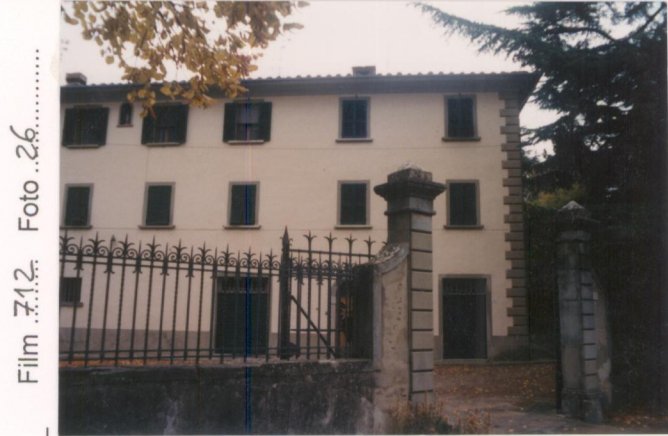
Film 7.12: Foto 26 p.v. N. 2