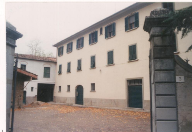
Film 7.12: Foto 25 p.v. N. 3. Prospetto principale