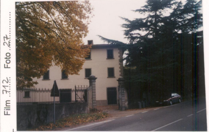
Film 7.12: Foto 27 p.v. N. 1. Veduta dalla S.S. Umbro-Casentinese