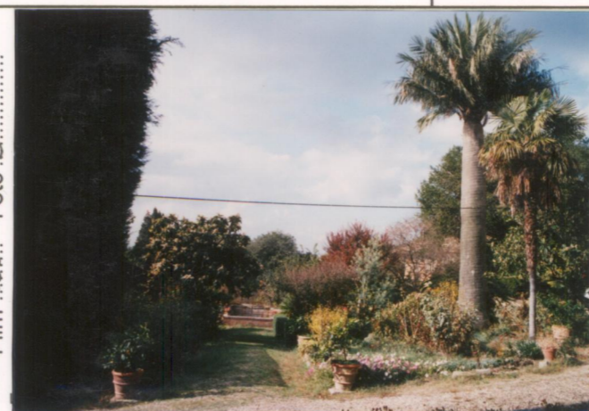
Film 660. Foto 3. p.v. N. 3