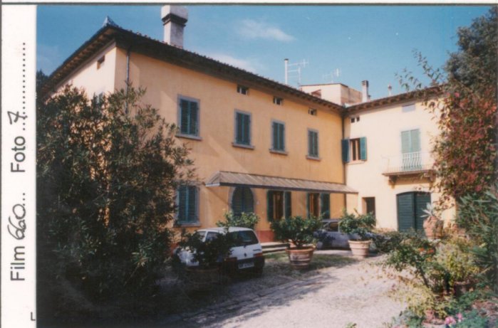
Film 660. Foto 1. p.v. N. 1