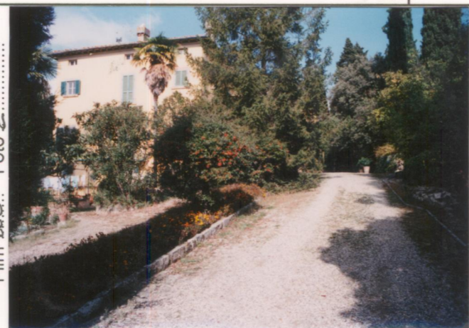
Film 660. Foto 2. p.v. N. 2