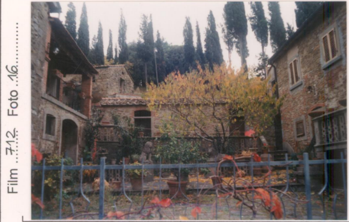
Film 7.12. Foto 16