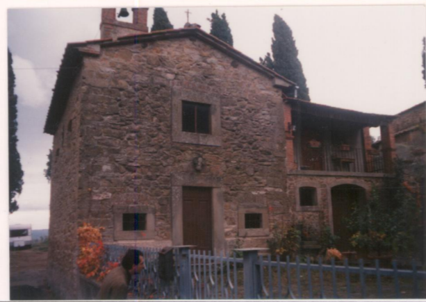
Film 7.12. Foto 15