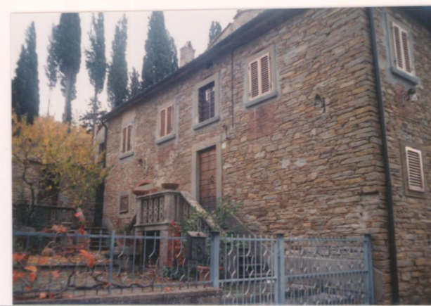
Film 7.12. Foto 14