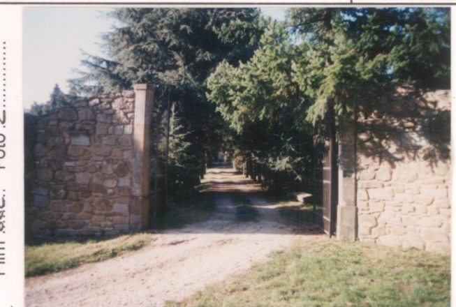
Film 662. Foto 2