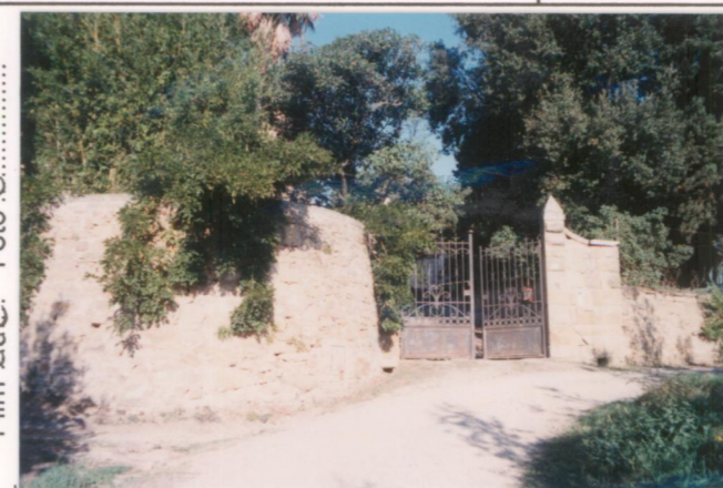
Film 662. Foto 6