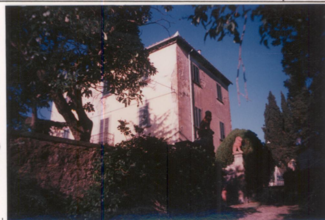
Film 662. Foto 5