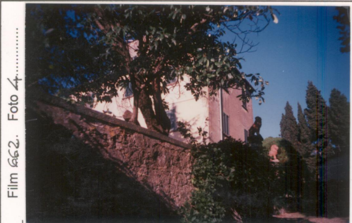
Film 662. Foto 4