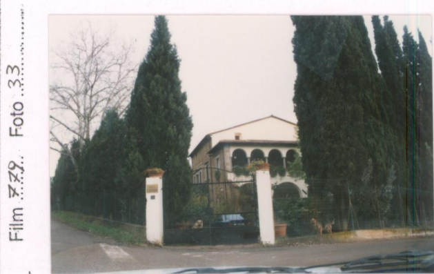
Film 7.79. Foto 3.3