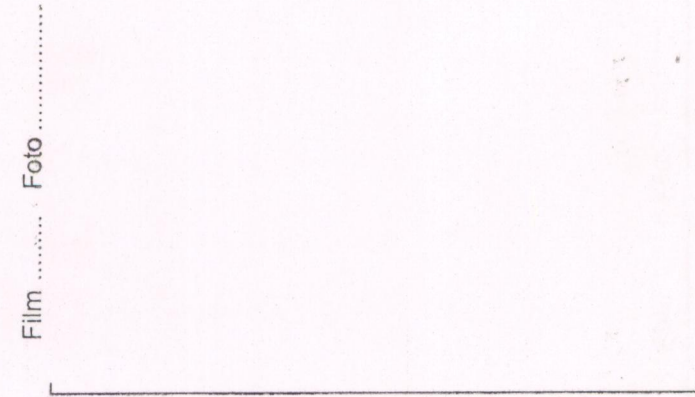
Film ..... Foto .....