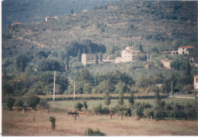
p.v. N. 1. Veduta della villa da Il Sodo.....