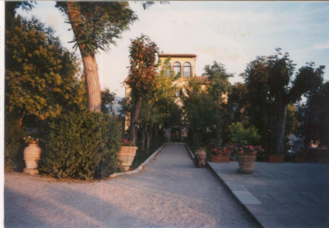
p.v. N. 2. Fronte principale.....