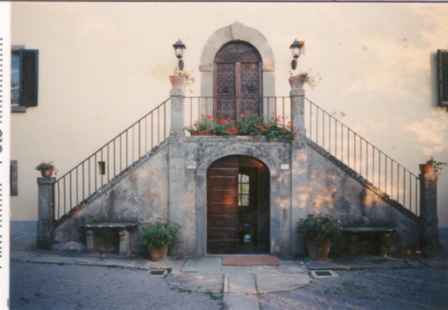
p.v. N. 3. La scala d'ingresso.....