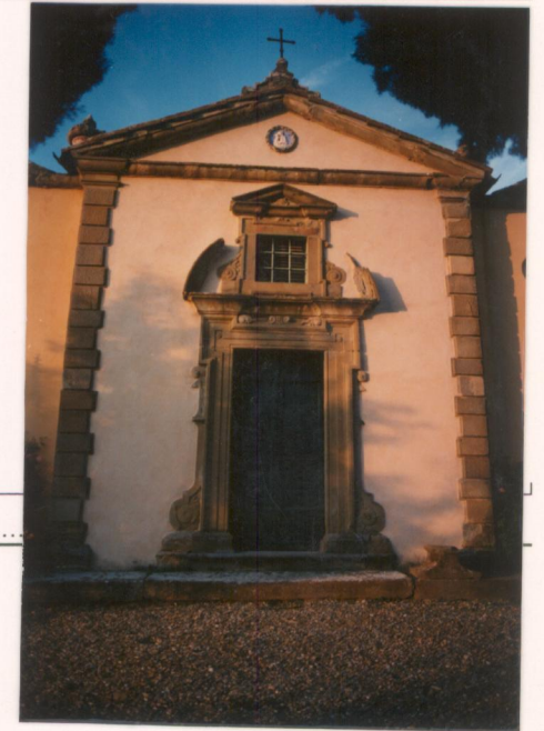
p.v. N. 7 La cappella