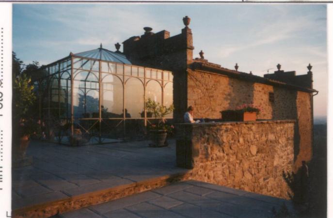
p.v. N. 4. La limonaia.....