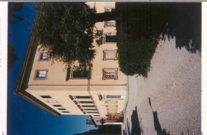
p.v. N. 4. Il corpo principale