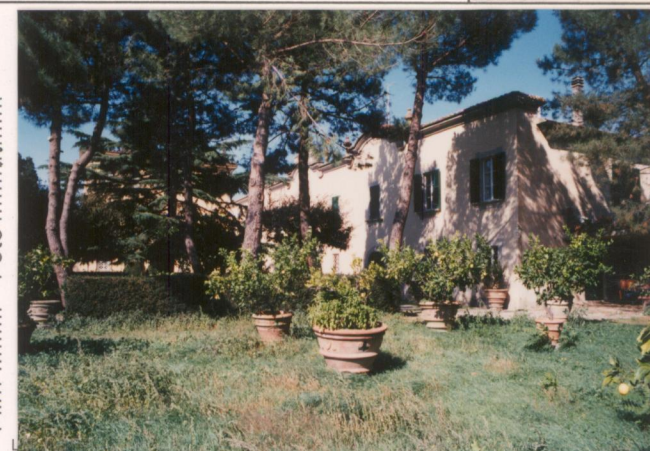
p.v. N. 8