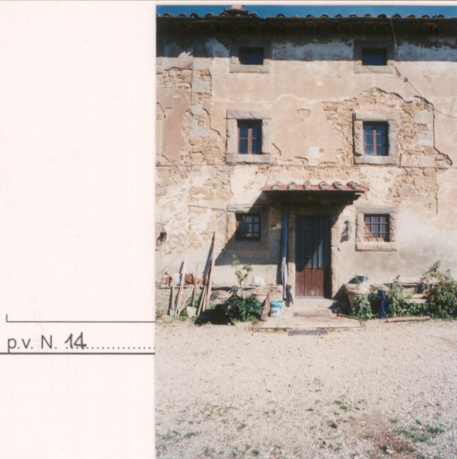
p.v. N. 14