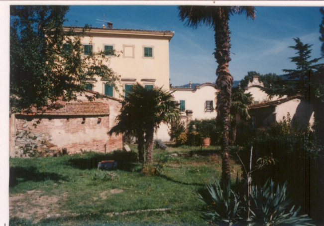
p.v. N. 10... Idem