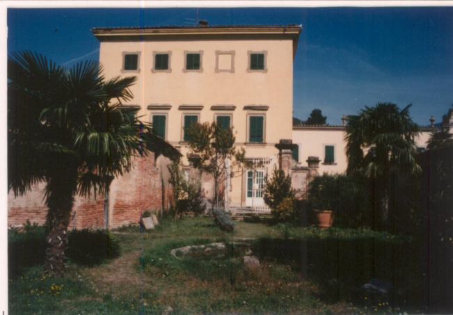
p.v. N.9... veduta dal giardino