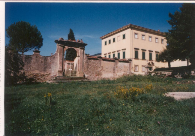
p.v. N. 11... Il muro che delimita il giardino formale