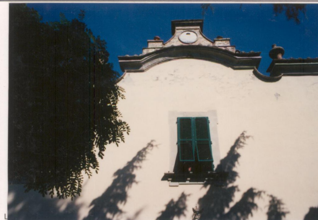
p.v. N. 7