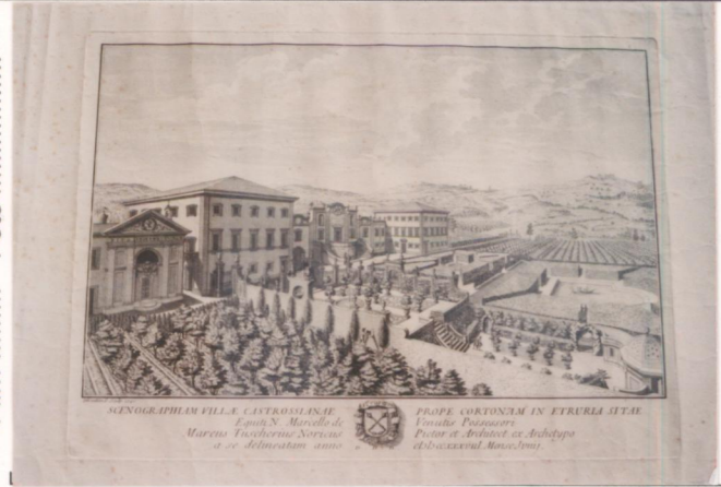
p.v. N. 1. "Scenographiam villae catrossianae." Marcus Tuscher