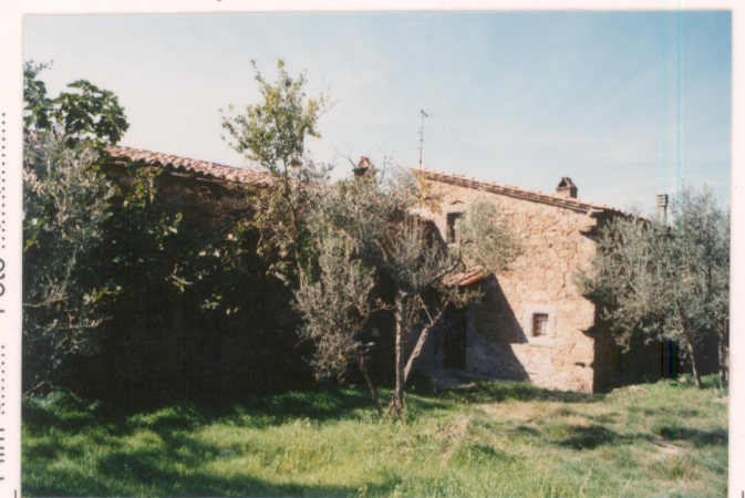
p.v. N. 16... veduta del prospetto a monte