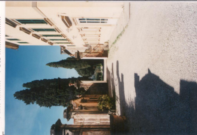
p.v. N. 3. Idem. (controcampo)