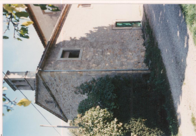
p.v. N. 13... La cappella