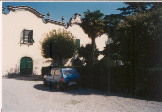
p.v. N. 6