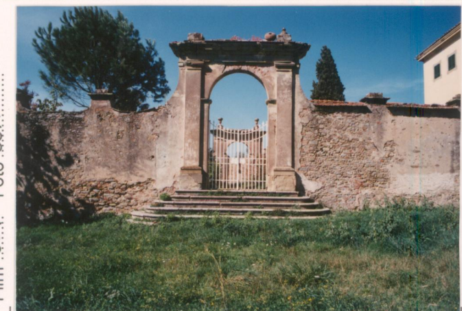
p.v. N. 12... Ingresso laterale del giardino