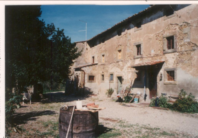
p.v. N.15... L'edificio che ospitava i forni per la produzione delle maiciche.