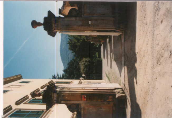
p.v. N. 2. L'ingresso della villa