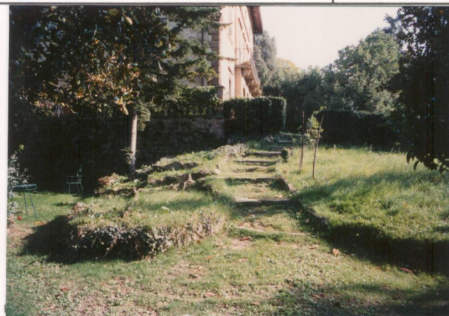
Film 65.1. Foto 26A