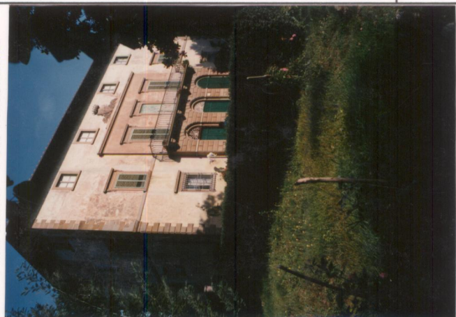
Film 65.1. Foto 24A