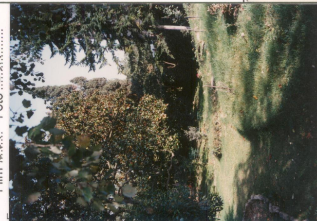
Film 65.1. Foto 25A