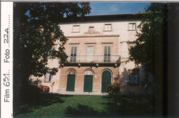
Film 65.1. Foto 22A