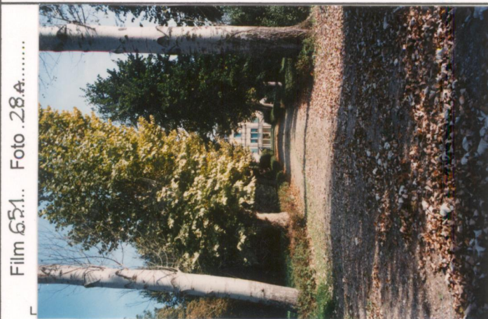
Film 651. Foto 28.A. p.v. N. 1. Il viale d'ingresso dismesso.