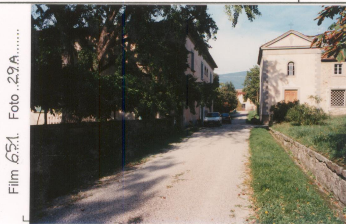
Film 651. Foto 29.A. p.v. N. 2. Il retro della villa e la cappella.