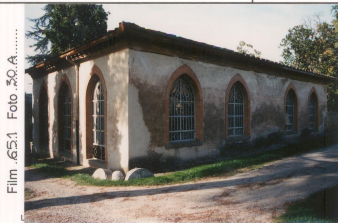
Film 651. Foto 30.A. p.v. N. 3. La limonaia.