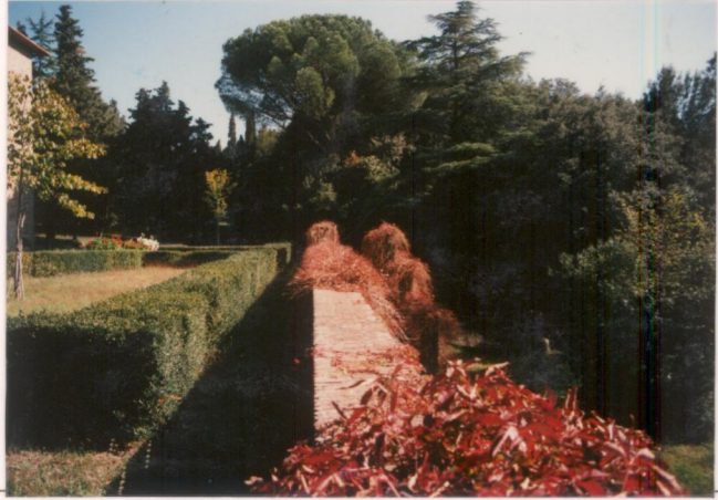
p.v. N. 5... Il muro che separa il giardino alla quota più bassa