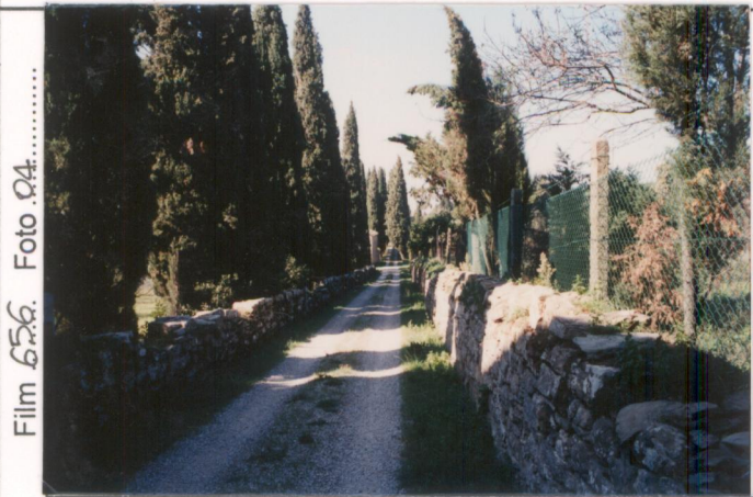
p.v. N. 1... Il viale d'ingresso alberato con muretti in pietra