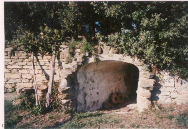
p.v. N. 7... Particolare del giardino