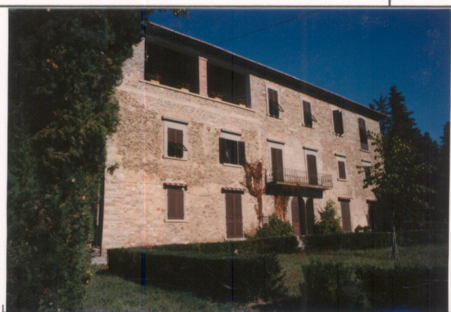
p.v. N. 2... Fronte principale