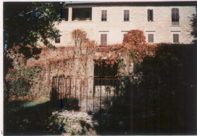
p.v. N. 6... Il fronte principale del giardino