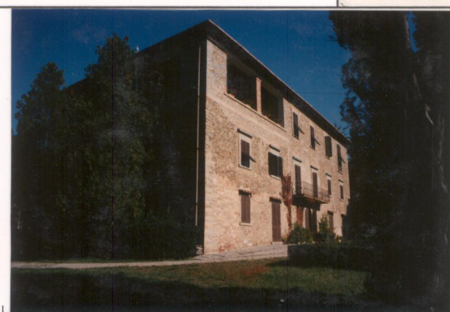
p.v. N. 4...