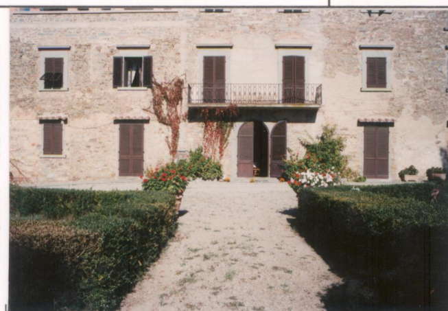
p.v. N. 3... Idem, particolare