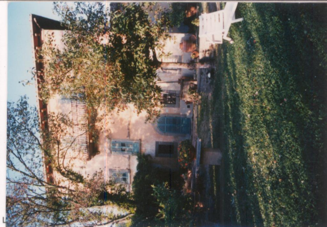
Film 658 Foto 21.A..... p.v. N. 2...Idem.....