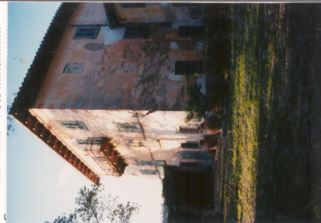
Film 658 Foto 25.A..... p.v. N. 3.....