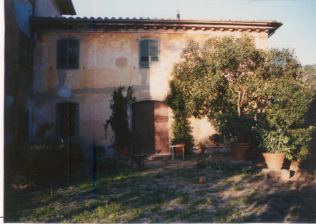
p.v. N. 6...La...limonaia.....