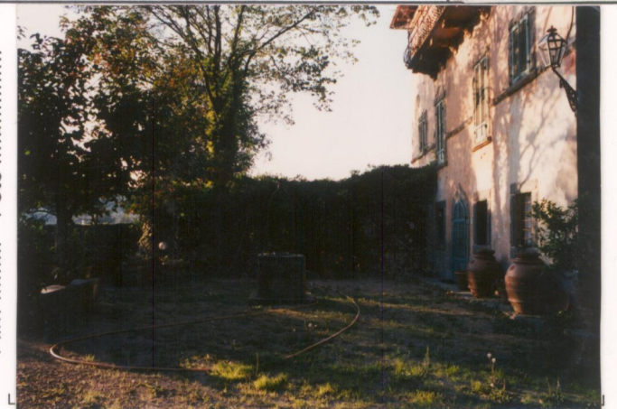
Film 658 Foto 26.A..... p.v. N. 4...Scorcio...della...facciata...sul giardino