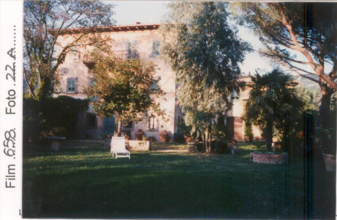
Film 658 Foto 22.A..... p.v. N. 1...Il...fronte...principale...dal giardino