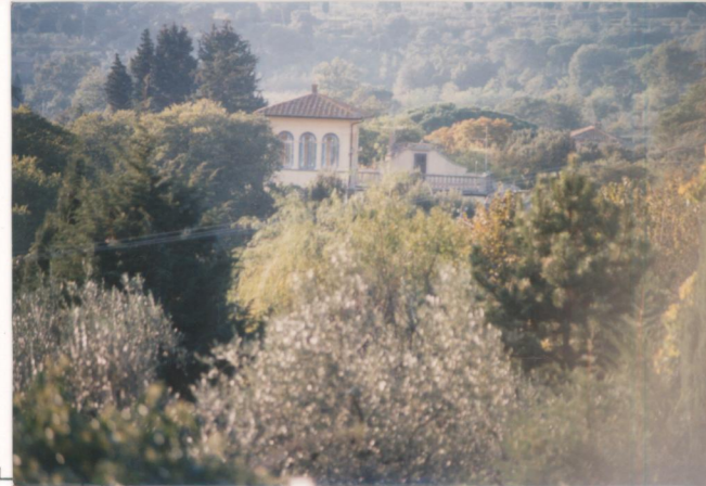
p.v. N. 1. Veduta della strada provinciale.