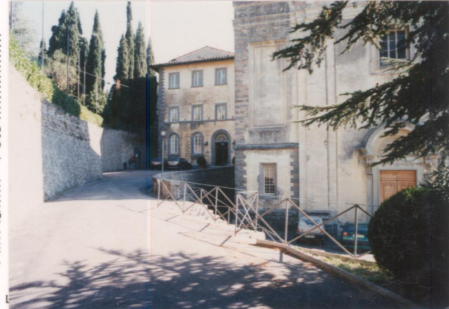
p.v. N. 6 L'ingresso dell'albergo