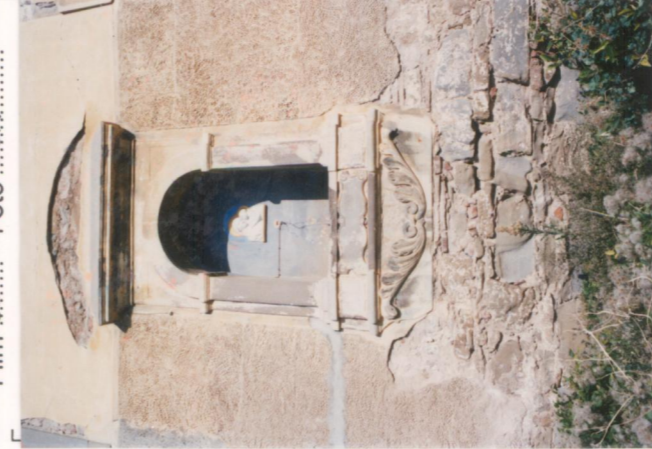
p.v. N. 7 Tabernacolo sul lato lungo la strada