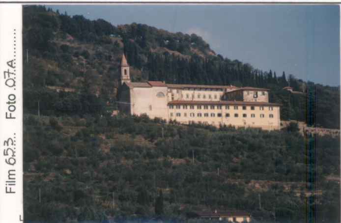
Film 65.3. Foto 07A.....