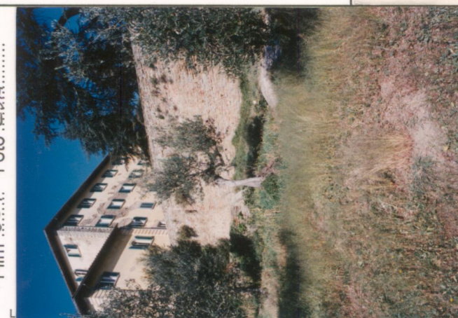
Film 65.7. Foto 25A.....