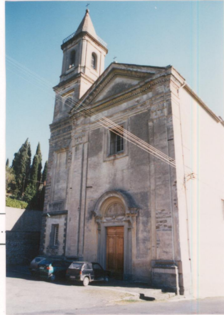
p.v. N. 5