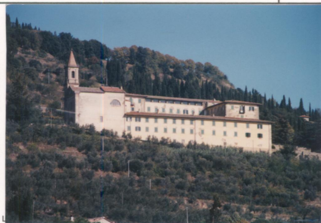
Film 65.6. Foto 11A.....