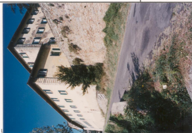
Film 65.7. Foto 24A.....