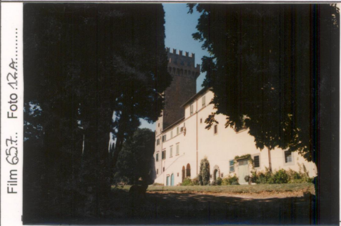
Film 657. Foto 12A.....