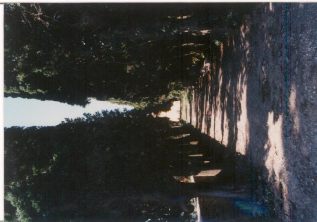
p.v. N. 5 Il viale alberato