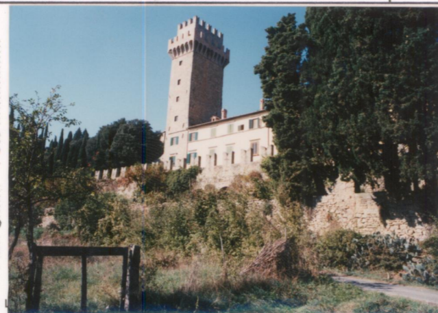
Film 657. Foto 16A.....