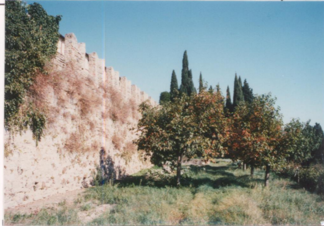
p.v. N. 6 Il frutteto