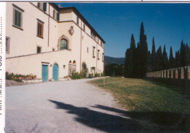
Film 657. Foto 19A.....