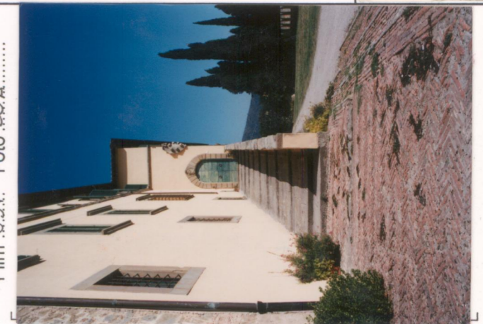
Film 657. Foto 20A.....