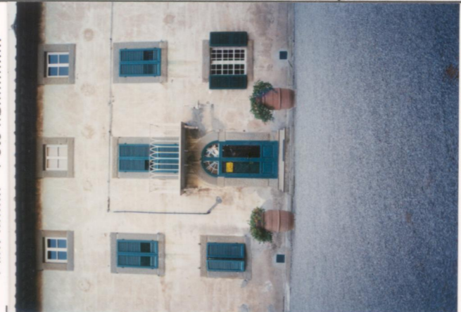
p.v. N. 3.....Particolare della facciata.....