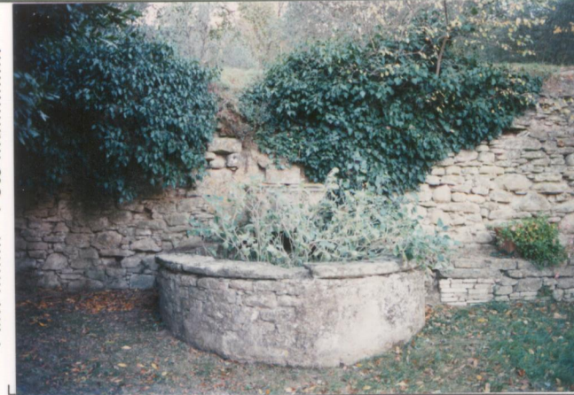
p.v. N. 7 Elementi di arredo in pietra