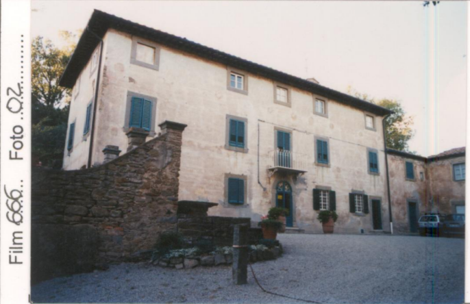
p.v. N. 1.....Fronte principale.....