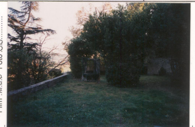
p.v. N. 4.....Veduta del giardino.....