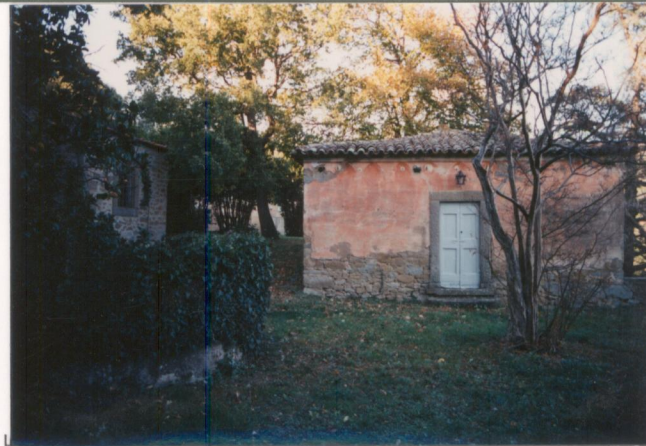
p.v. N. 6 Gli annessi del giardino