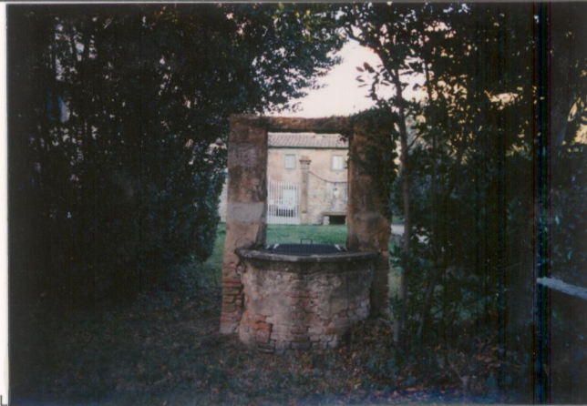
p.v. N. 5 Il pozzo in laterizi