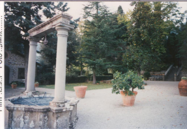
Film 657 Foto 34A..... p.v. N. 3...veduta verso il parco.....