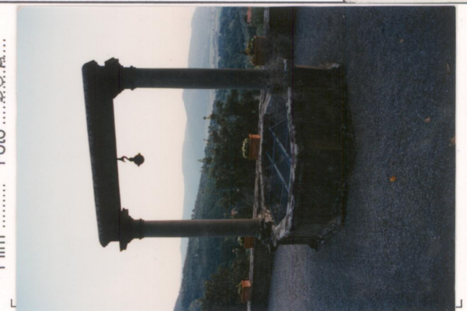
Film 657 Foto 36A..... p.v. N. 4...veduta verso la Val d'Esse.....