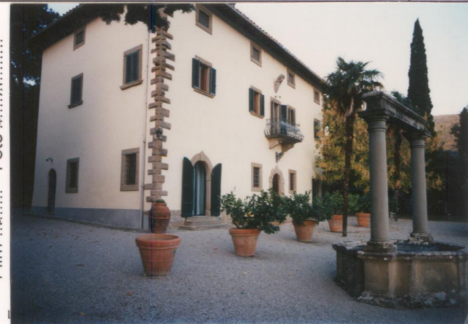
Film 657 Foto 33A..... p.v. N. 2.....