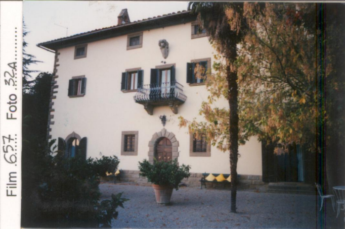
Film 657 Foto 32A..... p.v. N. 1.....Fronte principale della villa.....