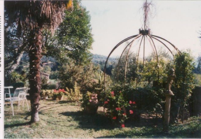
p.v. N. 3.....Elementi...di arredo...del giardino.....