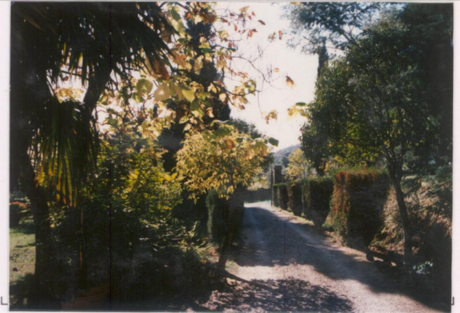
p.v. N. 4.....Il...Viale...di...ingresso.....