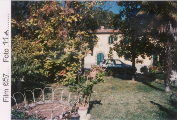
p.v. N. 2.....veduta...dal giardino.....