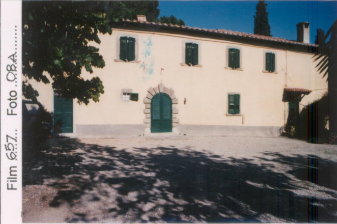
p.v. N. 1.....Fronte principale...della villa.....