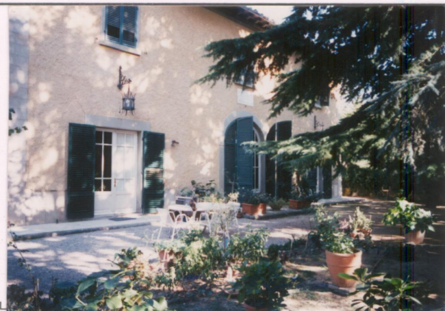
p.v. N. 1. Fronte principale.....