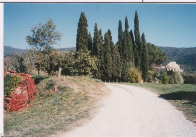
p.v. N. 3. Viale d'ingresso.....