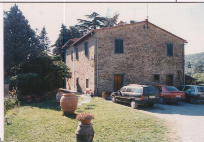
p.v. N. 2. Retro.....