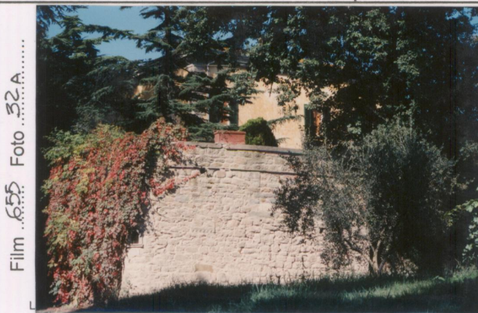
p.v. N. 3