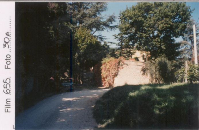
p.v. N. 2