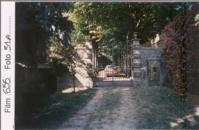
p.v. N. 1. Il cancello d'ingresso