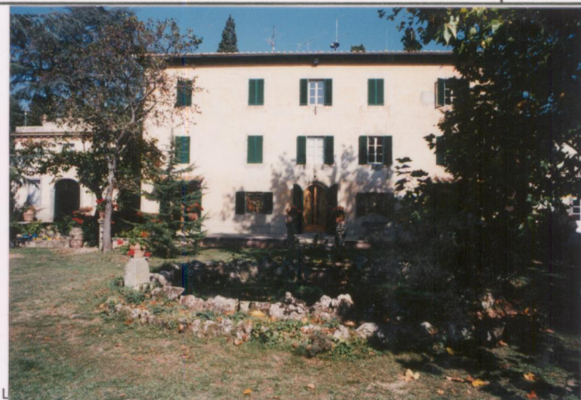
Film .655 Foto .34A.....