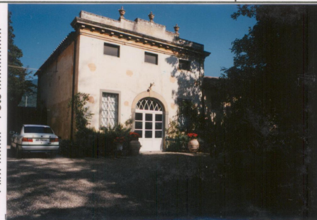
Film .655 Foto .35A.....