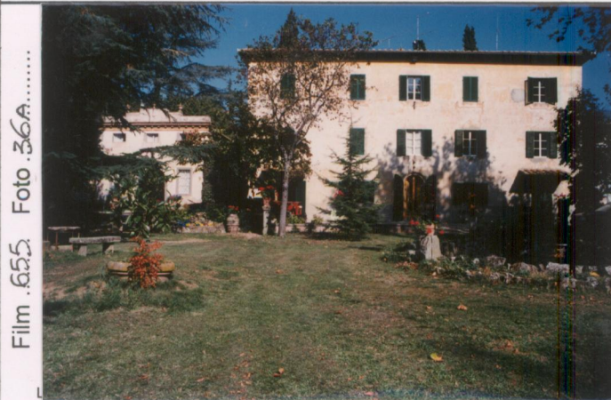
Film .655 Foto .36A.....