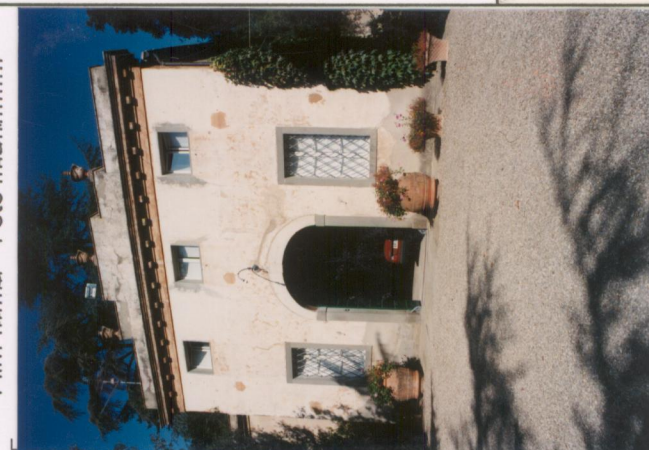
Film .655 Foto .33A.....