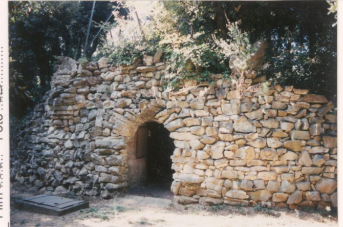
p.v. N. 7 Idem