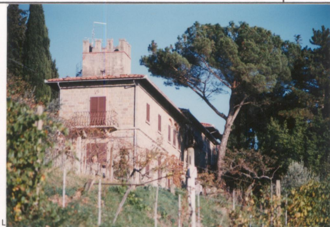
Film 659. Foto 25. p.v. N. 2.