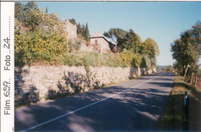
Film 659. Foto 24. p.v. N. 1. veduta dalla s.p. 34