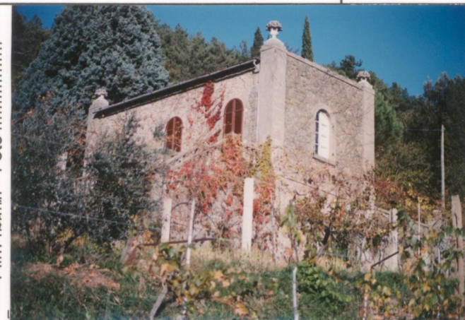
Film 659. Foto 26. p.v. N. 3.