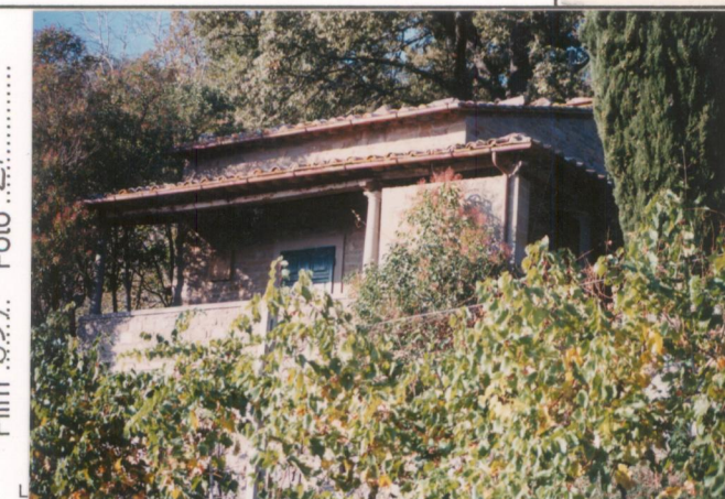
Film 659. Foto 27. p.v. N. 4.