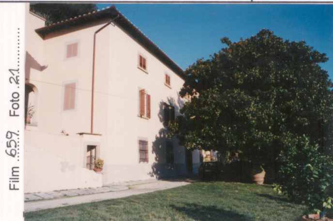
Film 659. Foto 21..... p.v. N. 3. Il fronte principale.....