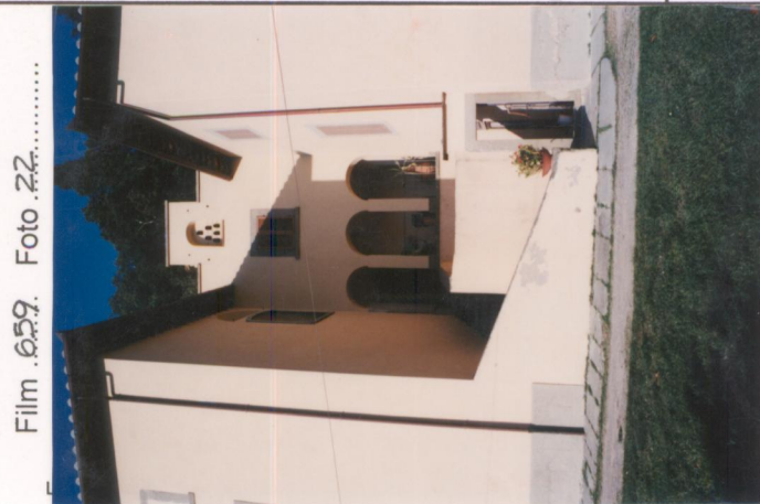
Film 659. Foto 22..... p.v. N. 2. La loggia che unisce i due corpi della villa.....