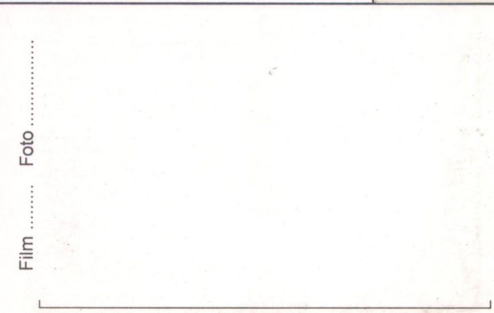
Film ..... Foto ..... p.v. N. ....