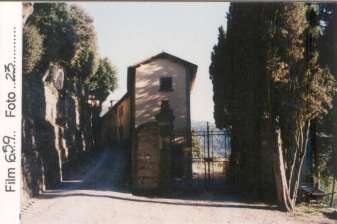
Film 659. Foto 23..... p.v. N. 1. L'ingresso della villa.....