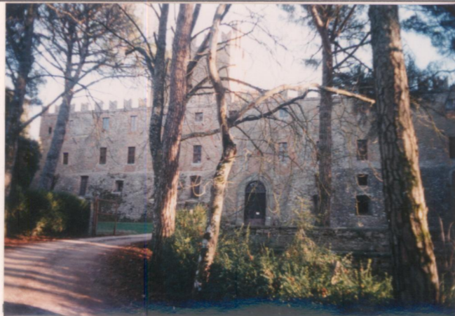
p.v. N. 2..... Il fronte principale.....