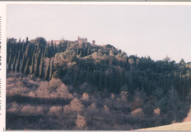
p.v. N. veduta dalla strada di accesso.....