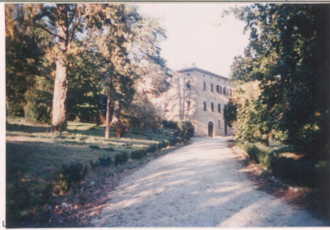
Film 716. Foto 24A..... p.v. N. 2.....