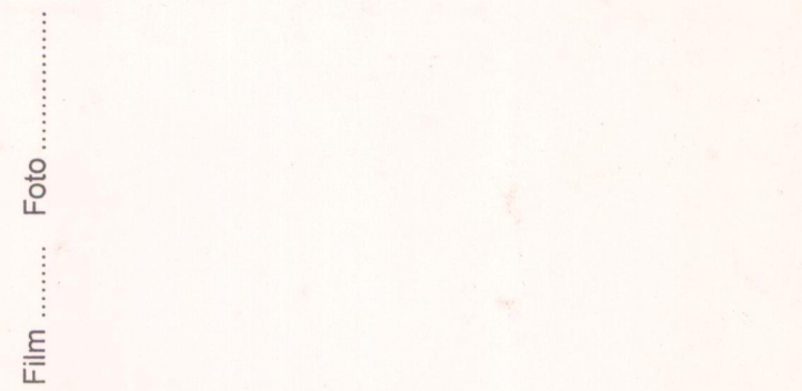
Film ..... Foto ..... p.v. N. ....