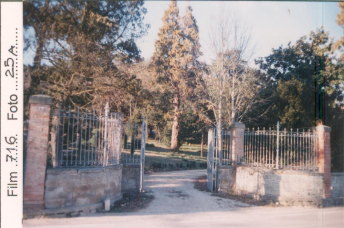
Film 716. Foto 25A..... p.v. N. 1.....L'ingresso alla villa.....