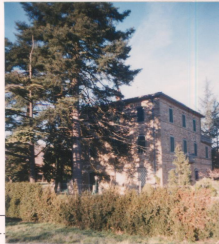
p.v. N. 1