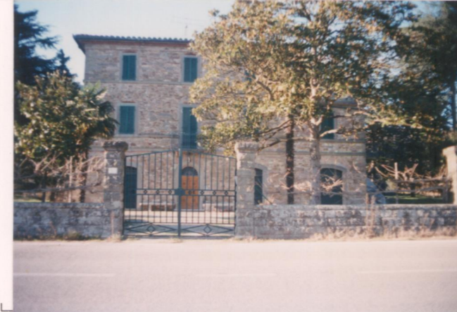
p.v. N. 3 Il fronte sulla s.s. 416