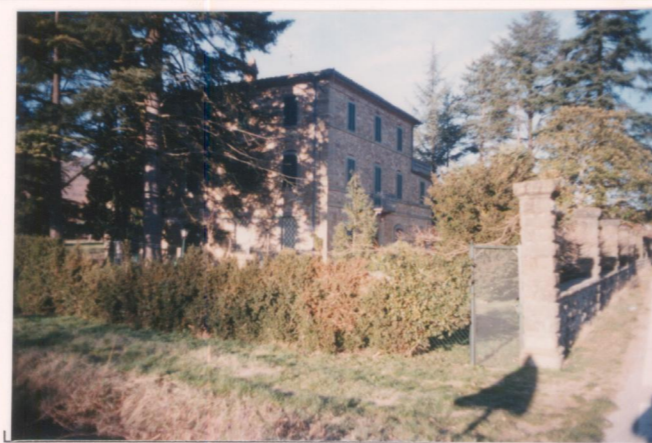
p.v. N. 2