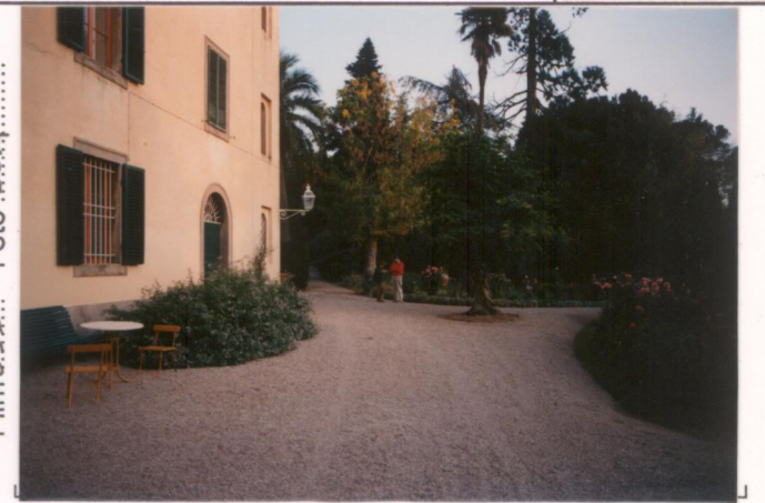
Film 653 Foto 30A p.v. N. 4