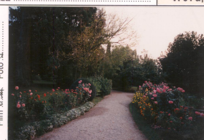
Film 654 Foto 4