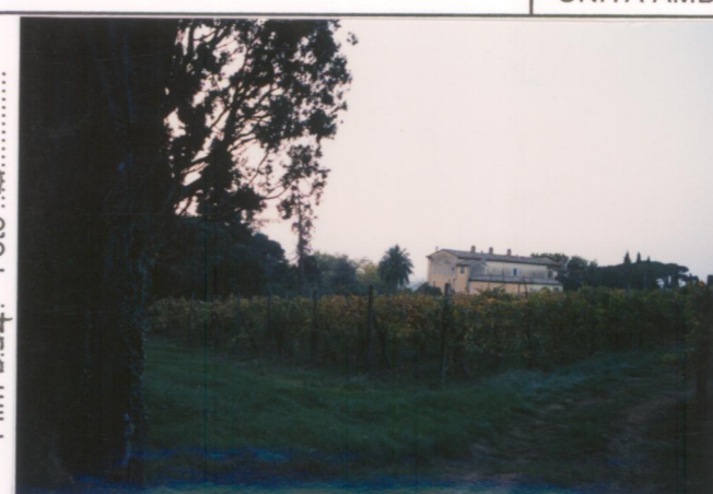
Film 654 Foto 5