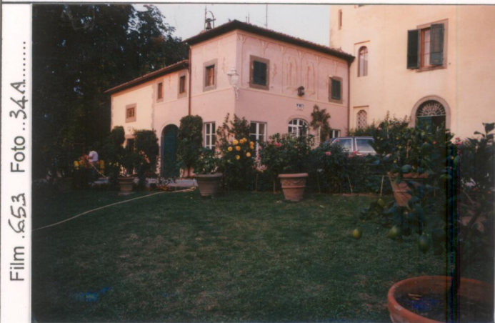
Film 653 Foto 34A