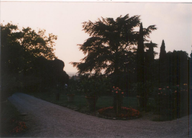
N°3 Film 653 Foto: 32A