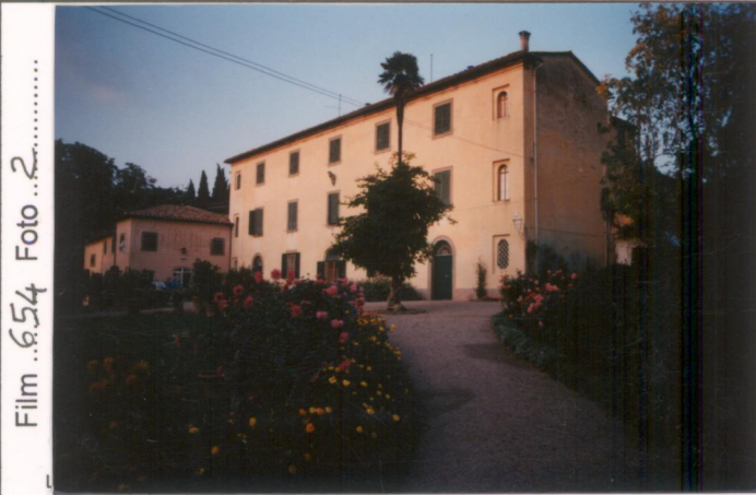
Film 654 Foto 2 p.v. N. 4