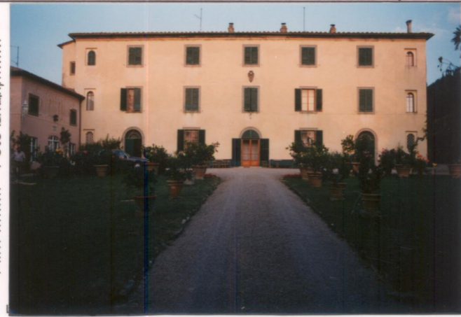
Film 653 Foto 25A p.v. N. 2