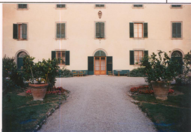
Film 653 Foto 33A