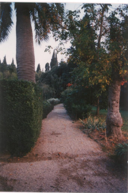
N°10 Film: 654 Foto: 4