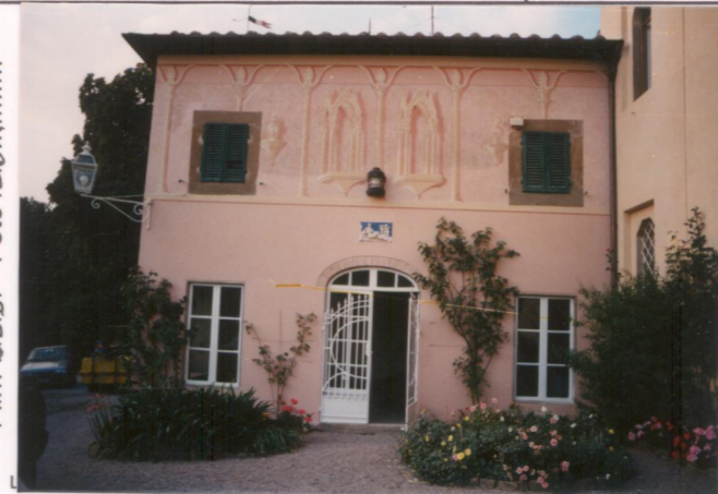
Film 653 Foto 36A p.v. N. 3