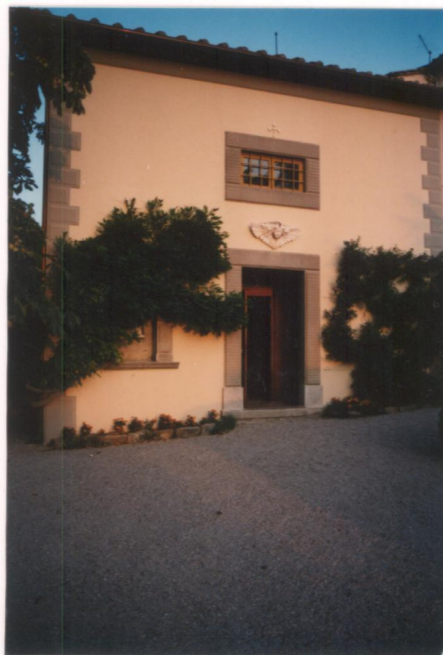
N°11 Film: 653 Foto: 28A