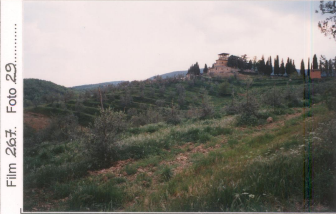
Film 267. Foto 29