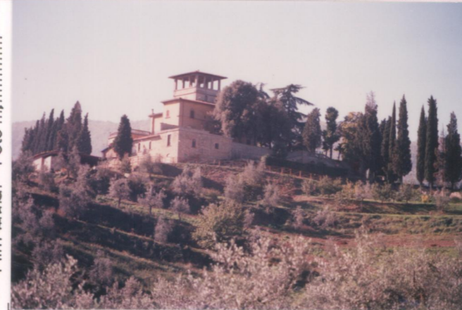
Film 598. Foto 4