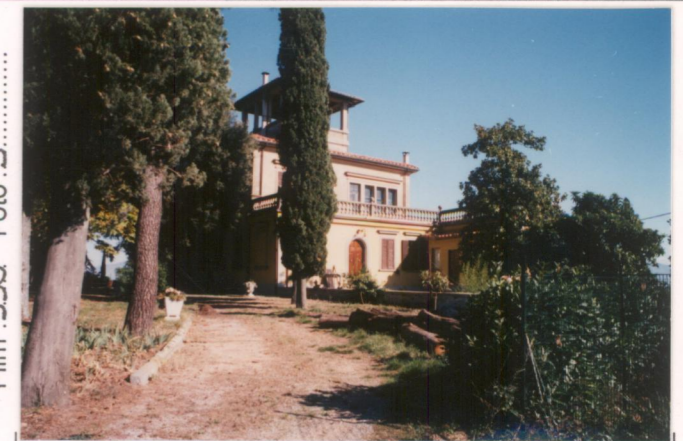
Film 598. Foto 3