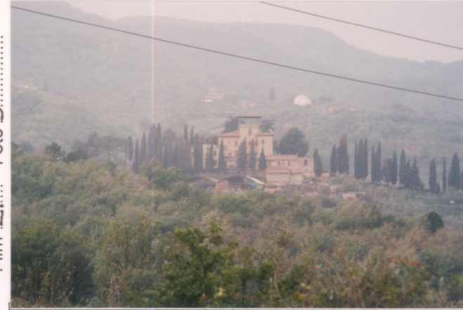
Film 27... Foto 5