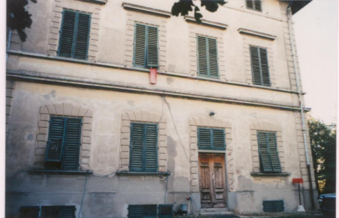
Film 701 Foto 7