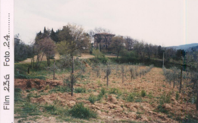
Film 236 Foto 24