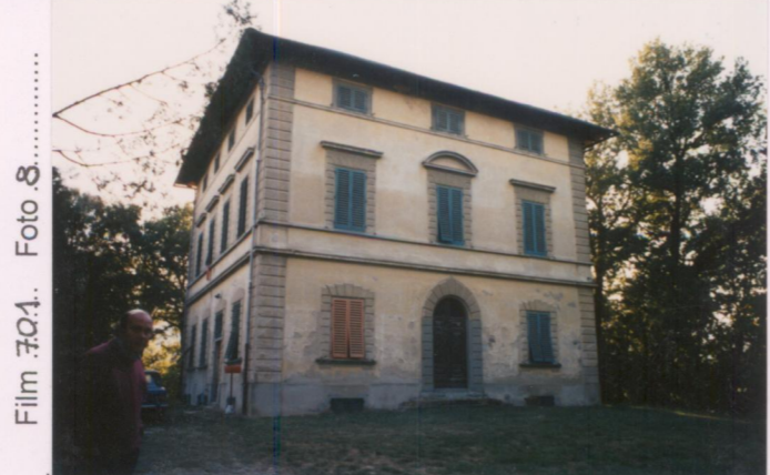
Film 701 Foto 8