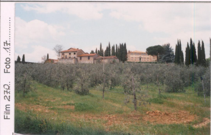
Film 270. Foto 17.....