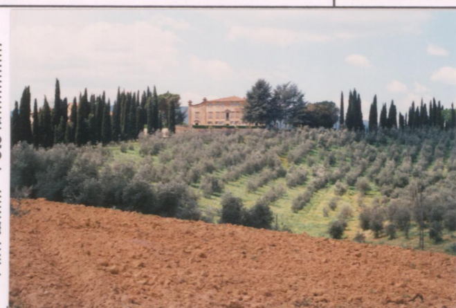
Film 270. Foto 8.....