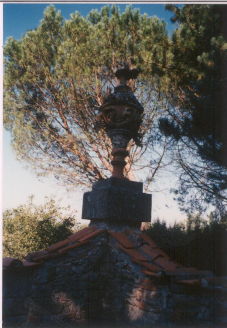
Film 598 Foto 23