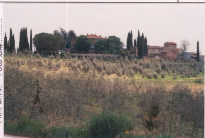
Film 270. Foto 34.....