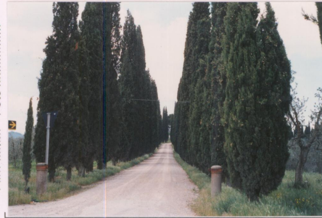
Film 270. Foto 10.....