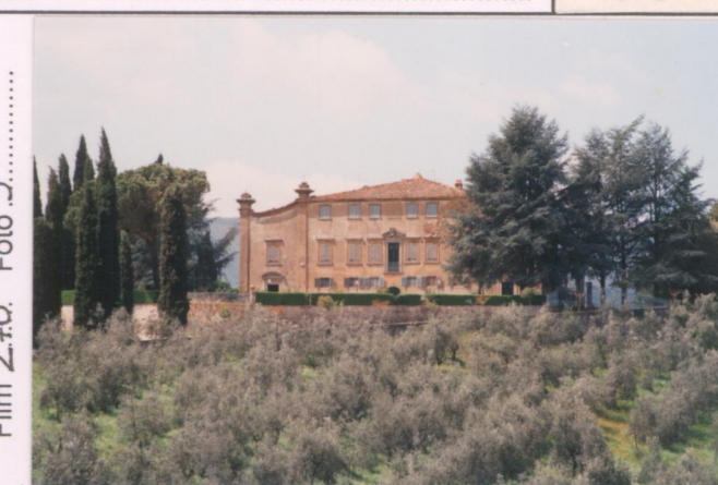
Film 270. Foto 9.....