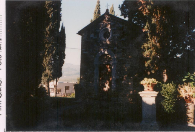
Film 598. Foto 21.....