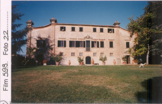
Film 598. Foto 22.....