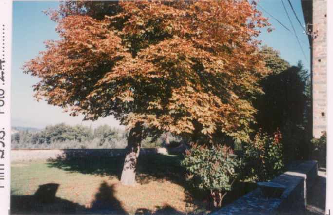
Film 598. Foto 24.....