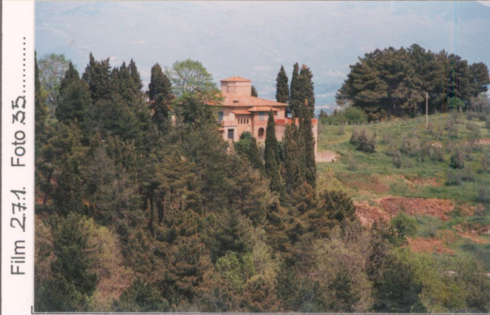
Film 274 Foto 35