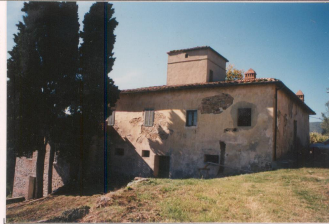
Film 598 Foto 6