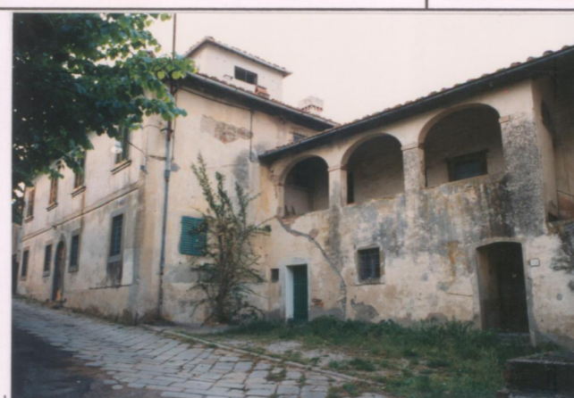
p.v. N. 2. Fronte e colonica annessa