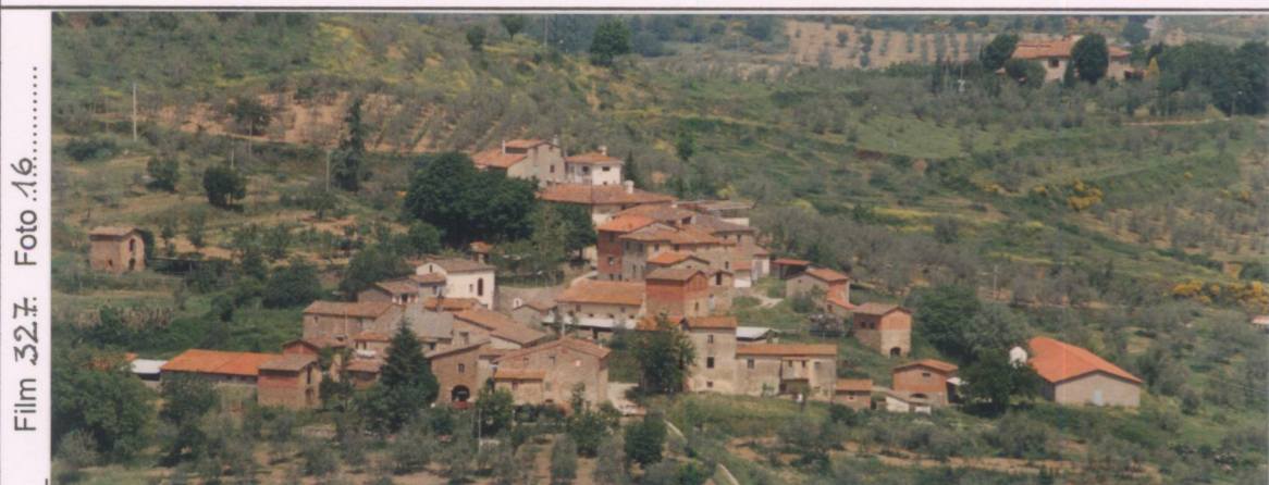
p.v. N. 1. Veduta da S. Marco