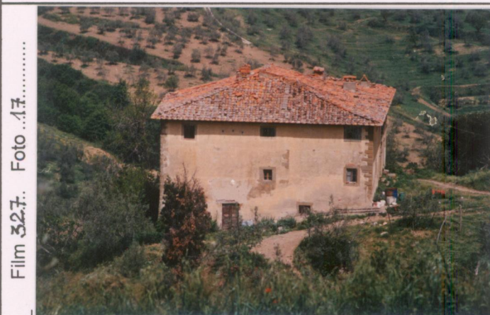
Film 327. Foto 17