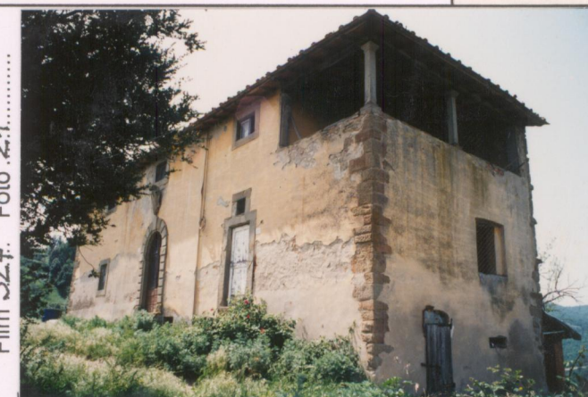
Film 327. Foto 21