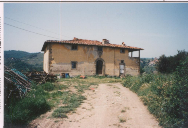
Film 327. Foto 19