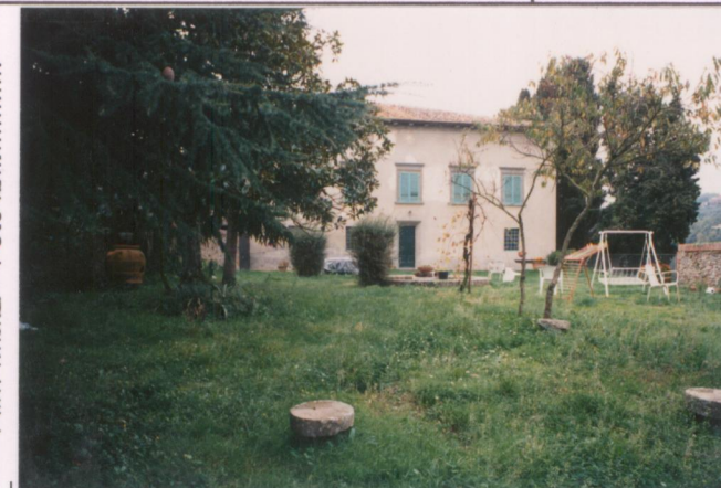
p.v. N. 3. Fronte a nord-est e giardino.....