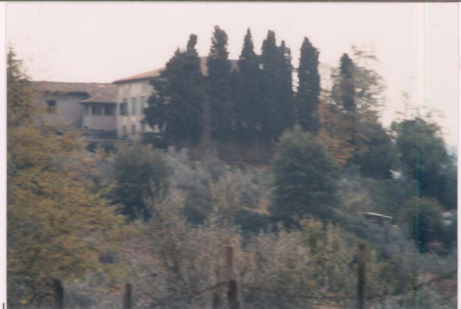
p.v. N. 1. Veduta dalla strada a Nord.....