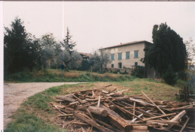
p.v. N. 2. Veduta da nord.....