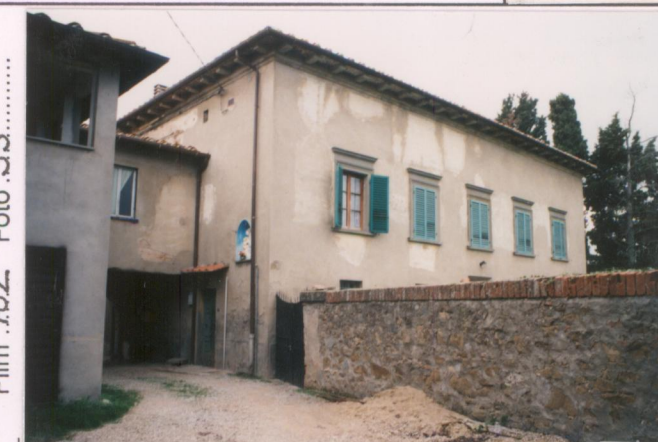
p.v. N. 4. Fronte a nord-est.....