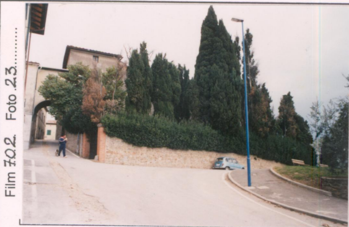
Film 702. Foto 2.3 ..... p.v. N. 1. Veduta da sud .....