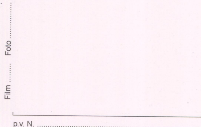
Film ..... Foto ..... p.v. N. ....