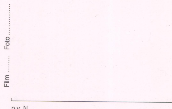
Film ..... Foto ..... p.v. N. ....