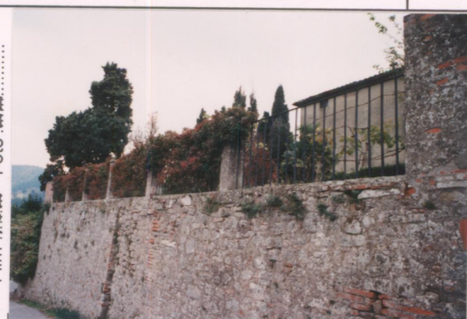
Film 702. Foto 2.2 ..... p.v. N. 2. Il muro di cinta a nord .....