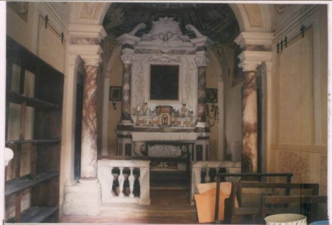
p.v. N. 5. Interno della cappella