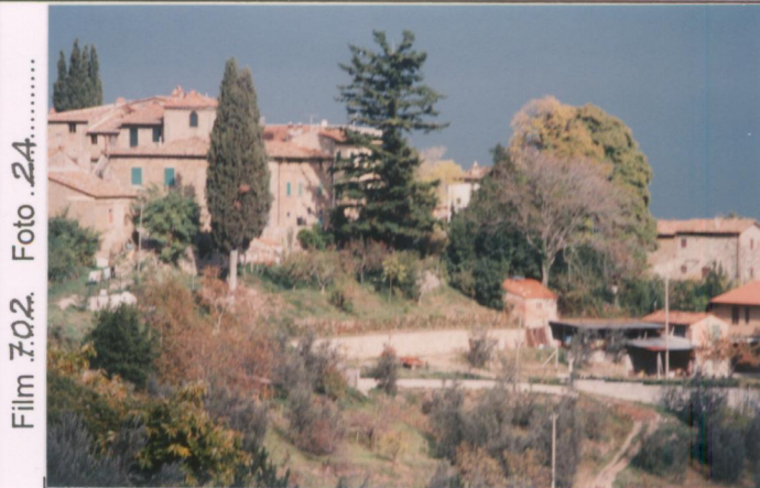
Film 702. Foto 24