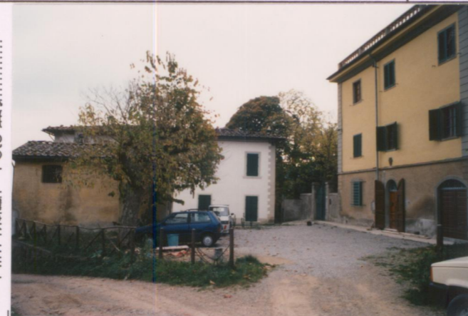
Film 702. Foto 29