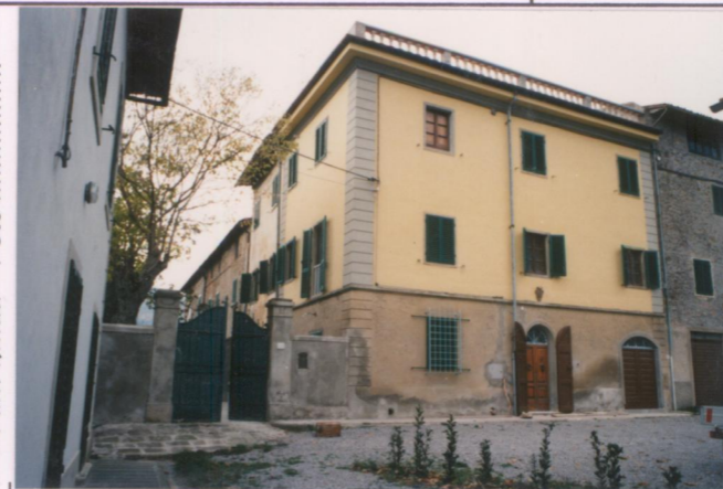
Film 702. Foto 26