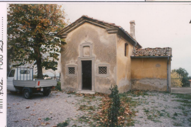
Film 702. Foto 25