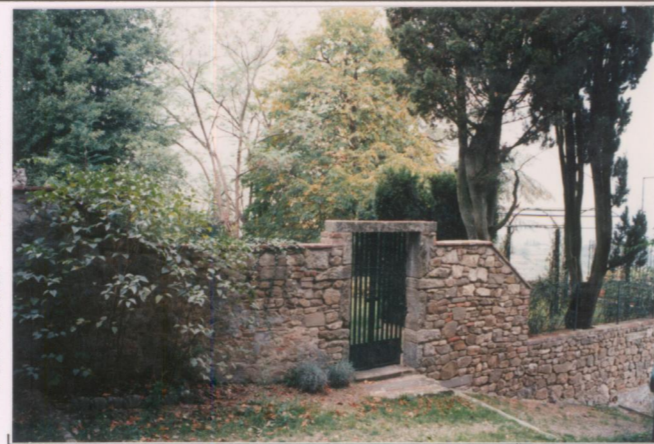
p.v. N. 6. Piccolo giardino a nord dell'abitato