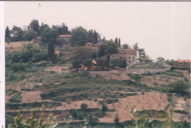
p.v. N. 1. Veduta da Ucerano.....