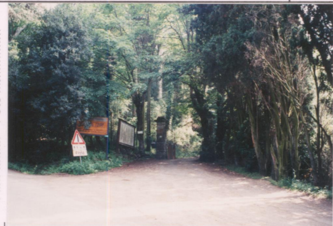
p.v. N. 2. Ingresso.....