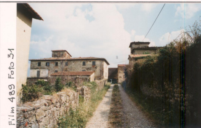
Film 4.89 Foto 3.1