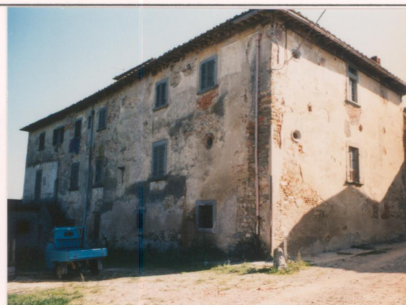
Film 6.00 Foto 3.7