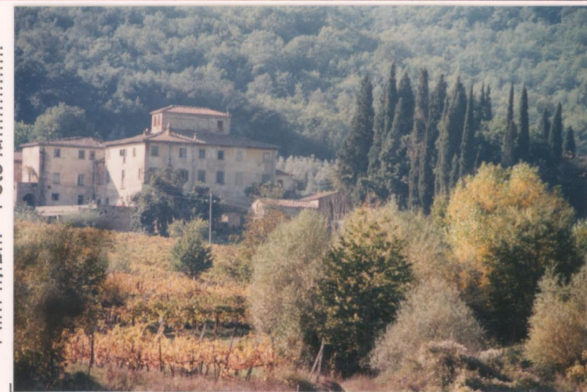
Film 701 Foto 5