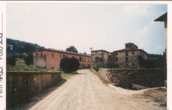
Film 489 Foto 28