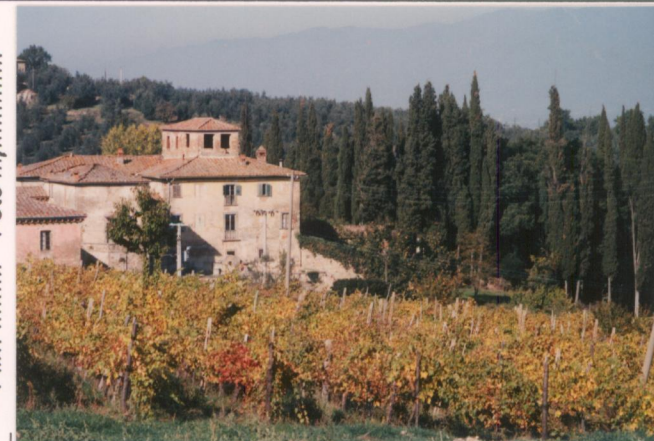
Film 701 Foto 4