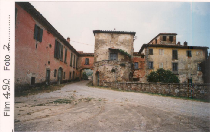
Film 4.90 Foto 2