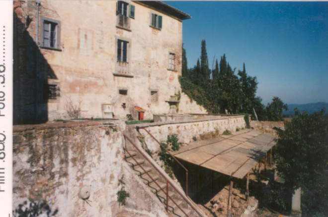
Film 6.00 Foto 3.6