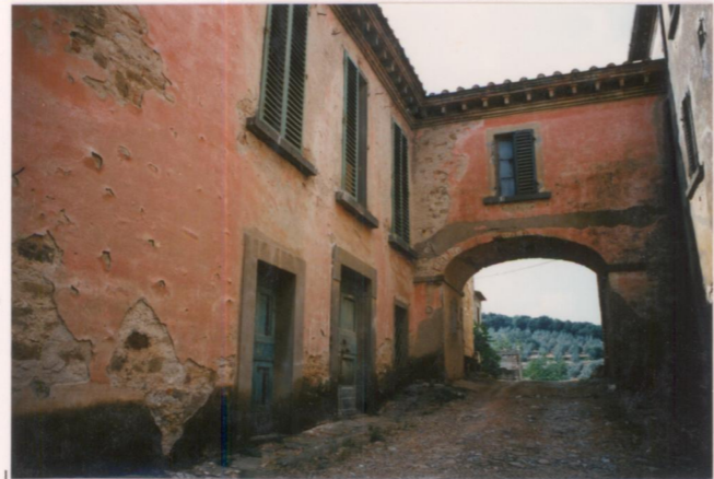
Film 4.89 Foto 2.9