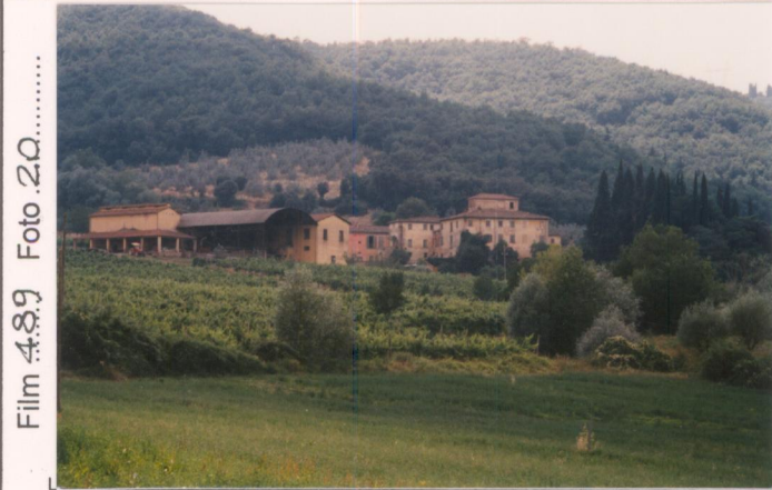
Film 489 Foto 20