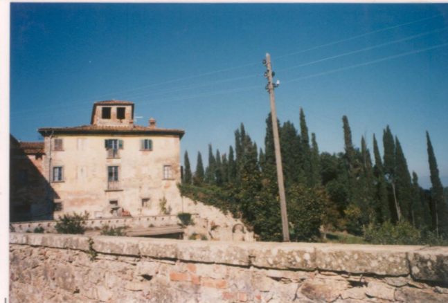
Film 6.00 Foto 3.5