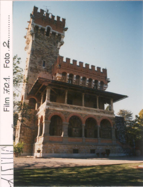
Film 70.1 Foto 2