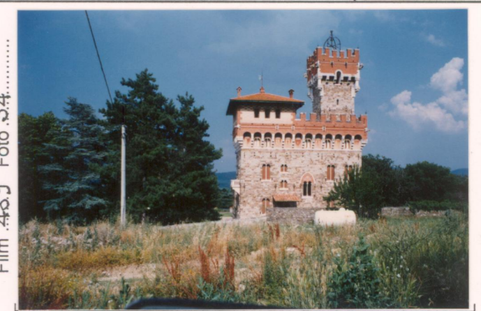
Film 48.9 Foto 3.4