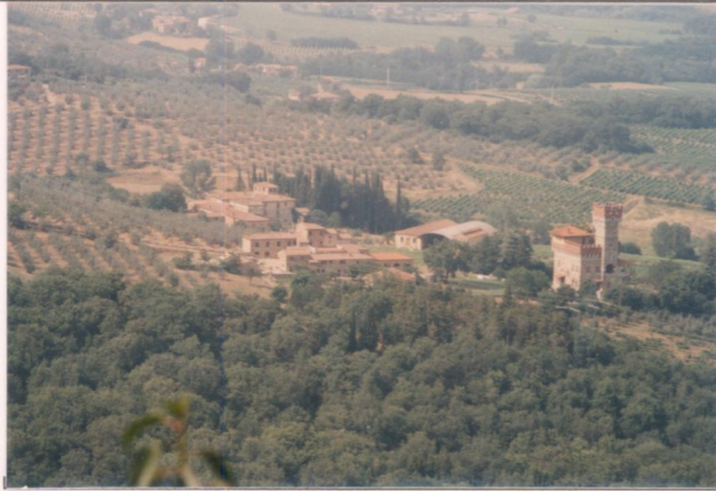
Film 49.1 Foto 2.5