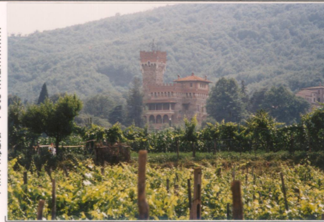
Film 48.9 Foto 1.8