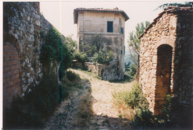
p.v. N. 6 Villino visto da nord