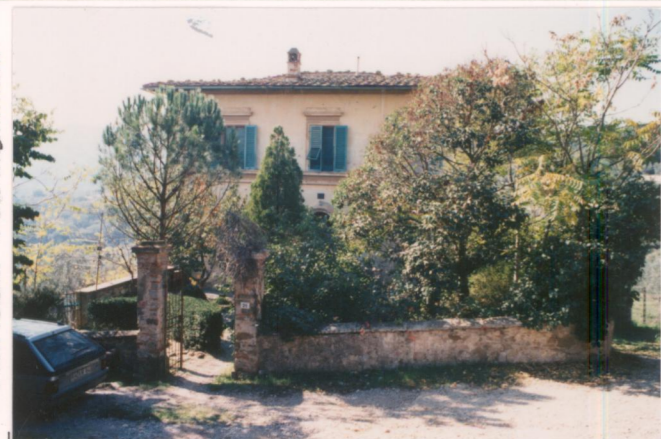
p.v. N. 5. Idem