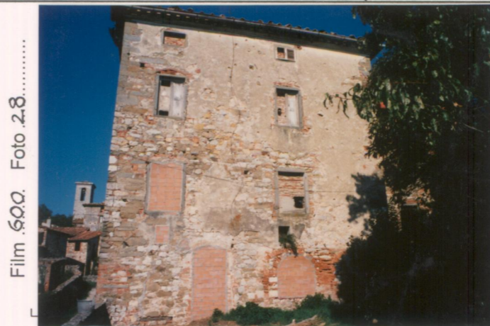
Film 600. Foto 28