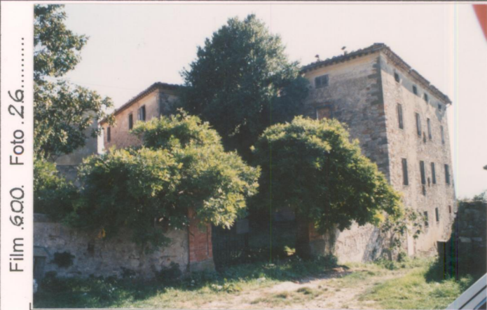
Film 600. Foto 26