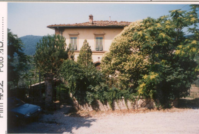
Film 492. Foto 10