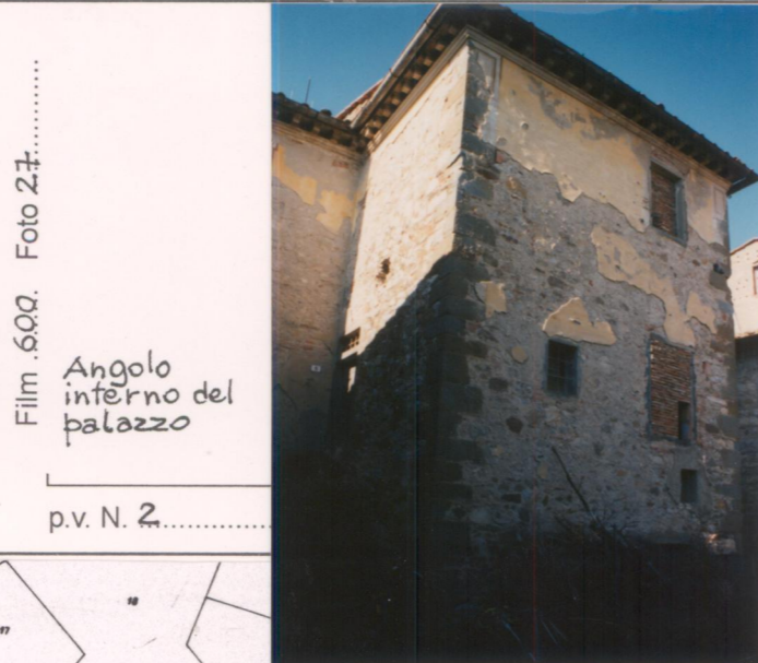
Film 600. Foto 27