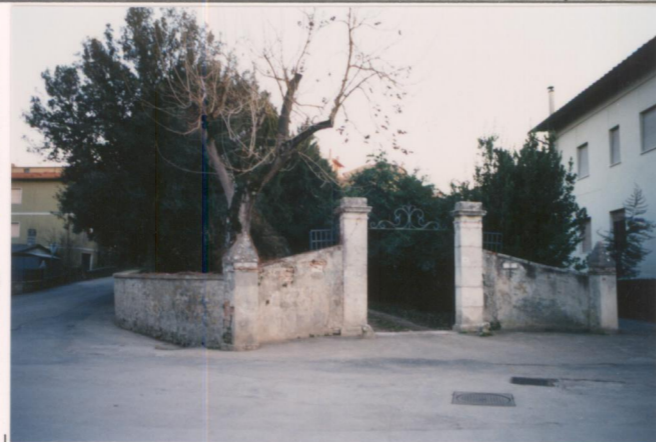
Film 705. Foto 32