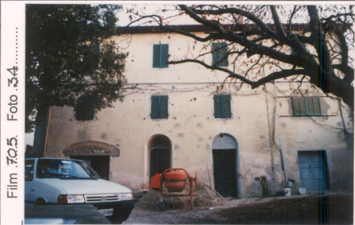
Film 705. Foto 34