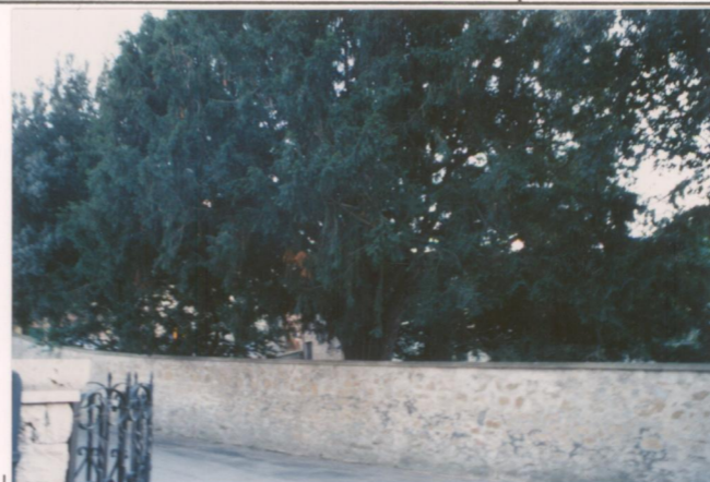
Film 705. Foto 33