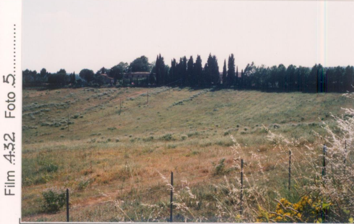
p.v. N. 1. Veduta dalla strada di Monte Benichi... (Silvanova)