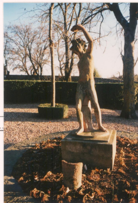
p.v. N. 10