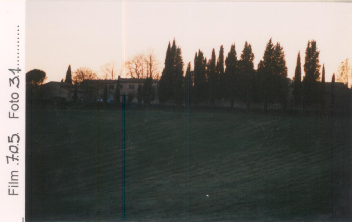
p.v. N. 2. Idem.....