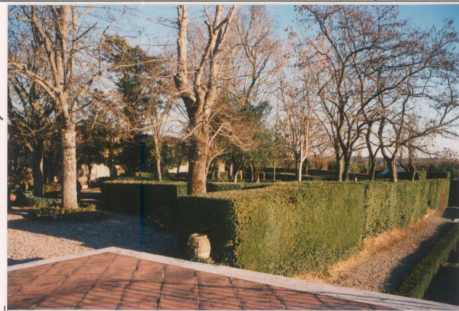
p.v. N. 6 I giardini formali: quello originario e solo quello di nuova progettazione