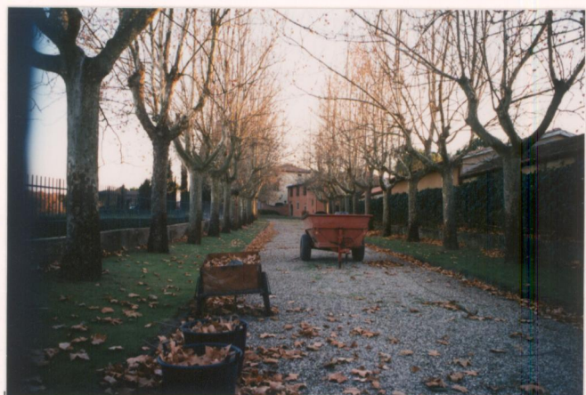
p.v. N. 8 Viale che conduce alla villa-fattoria