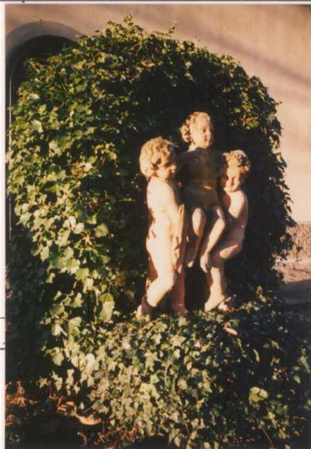
p.v. N. 9