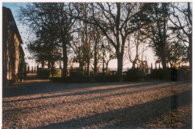
p.v. N. 5 Giardino a sud della villa