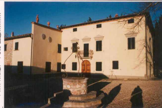
p.v. N. 3. Fronte ovest.....