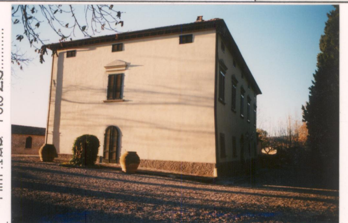
p.v. N. 4. La villa ripresa da sud.....