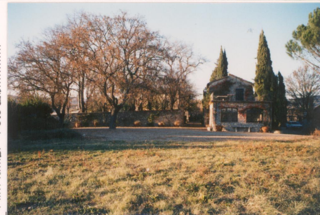
p.v. N. 7 Il complesso ripreso da sud