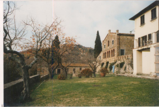
p.v. N.6 l'orto e l'ex-cantina.....