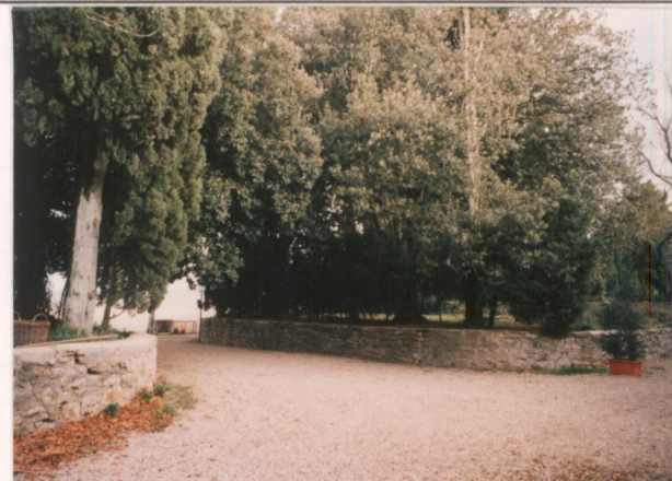
p.v. N9 Lecci fra la strada e la villa