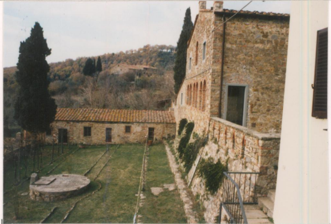
p.v. N5 Orto lungo il fronte a valle.....