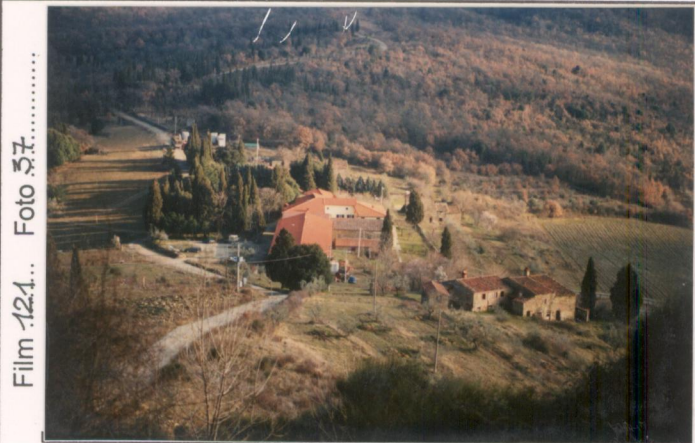
Film 124... Foto 37