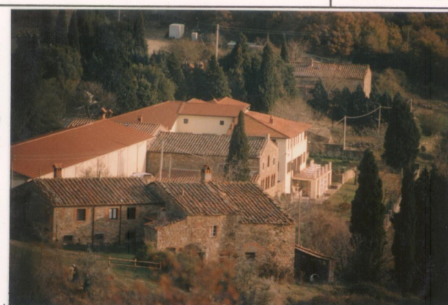
Film 708... Foto 3