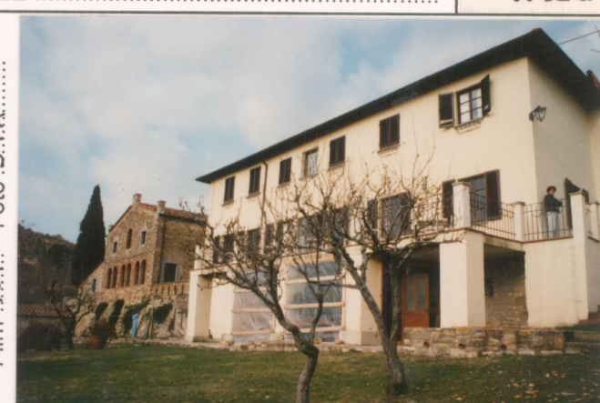
Film 707... Foto 34A