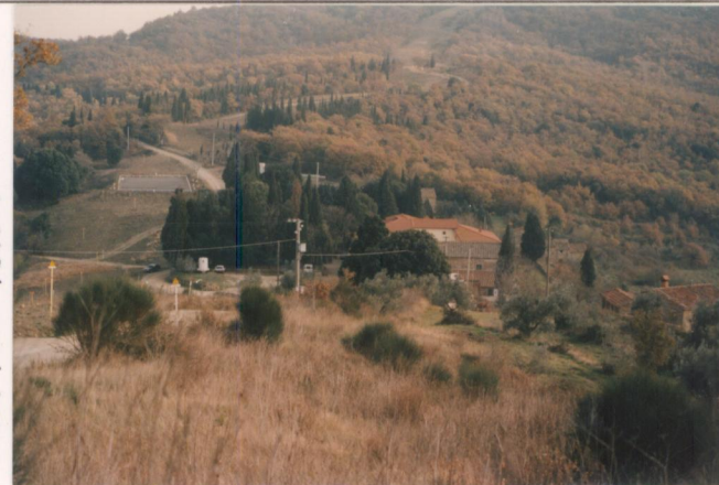
p.v. N10 Veduta dalla strada di Montelucci