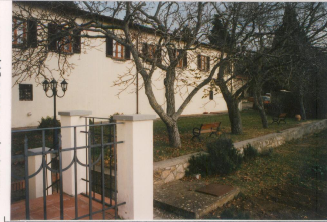
p.v. N. 7 Ala a sud-est.....