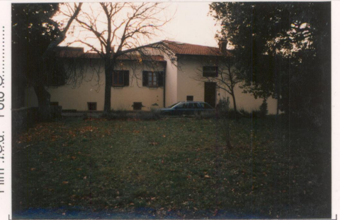
p.v. N. 8 Fronte verso la strada (nord-est)