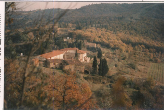
Film 708... Foto 2