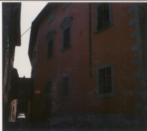
Film 599 Foto 34