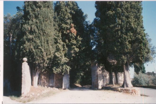
p.v. N. 6. Ingresso Sud al parco.....