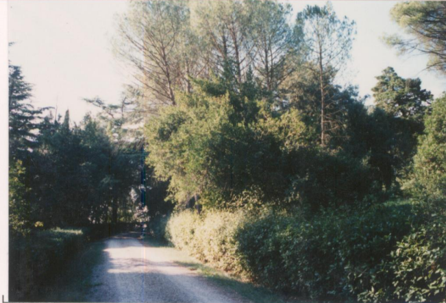
p.v. N. 7. Viale del Parco.....