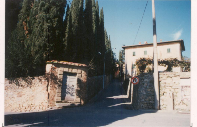
p.v. N. 9. Via che sale dalla pieve e piccola porta secondaria d'accesso al parco.....