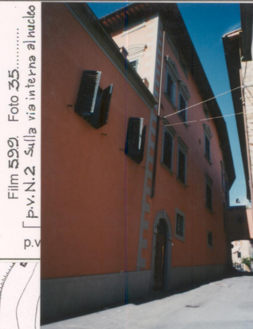
Film 599 Foto 35