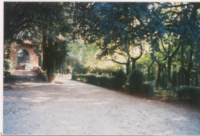
p.v. N. 8. S largo davanti alla villa e ingresso est.....