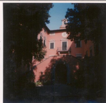
Film 600 Foto 9