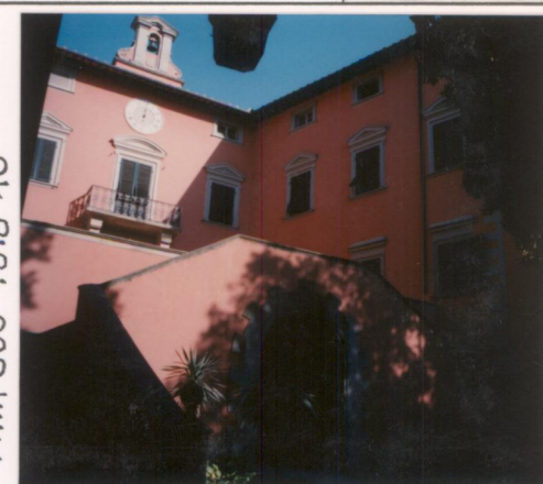
Film 600 Foto 10