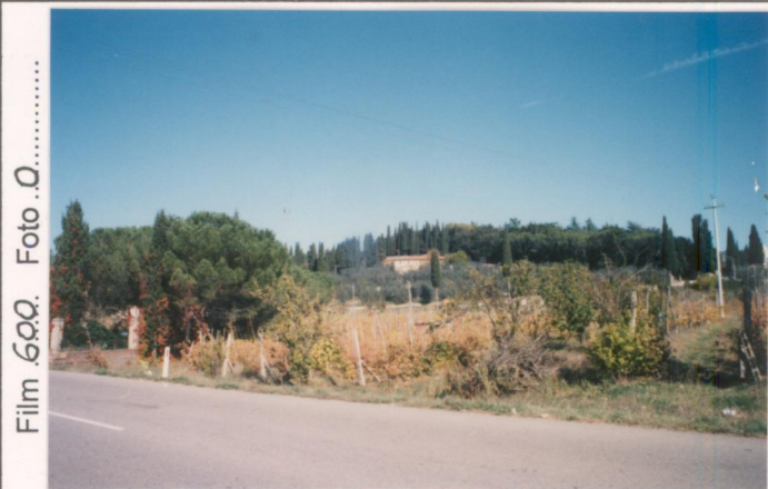
Film 600 Foto 0