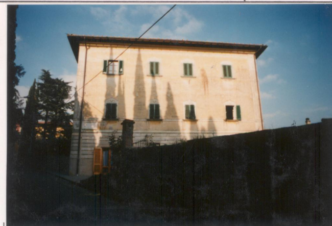
Film 707: Foto 30A.....