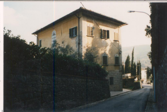
Film 707: Foto 31A.....