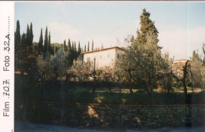
Film 707: Foto 32A.....