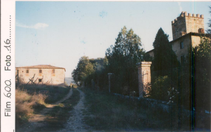
Film 600. Foto 16.....