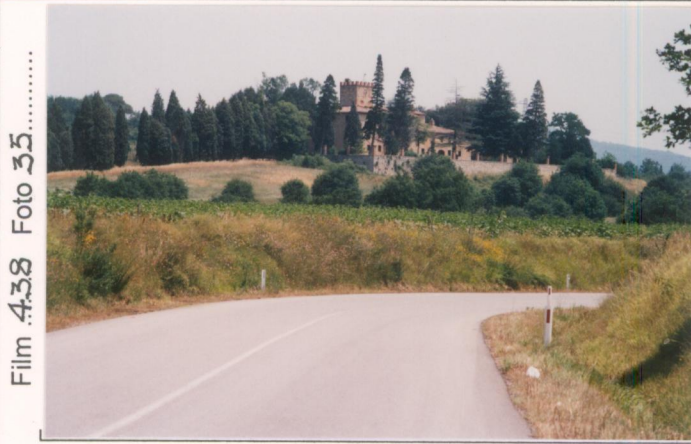
Film 438 Foto 35