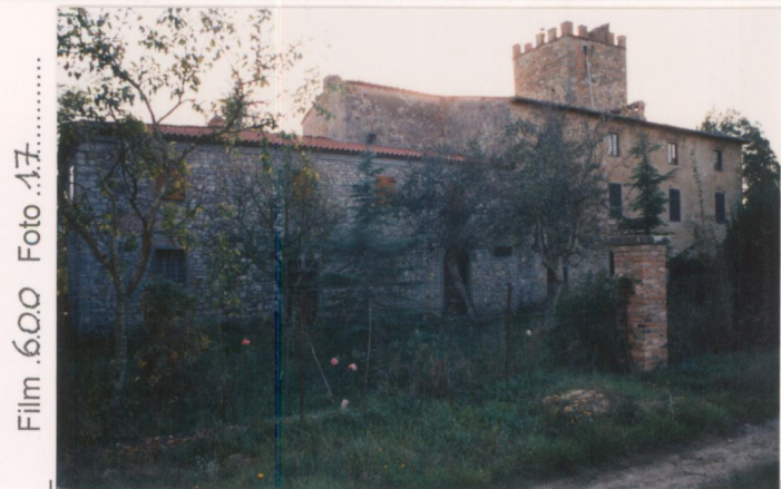
Film 600. Foto 17.....