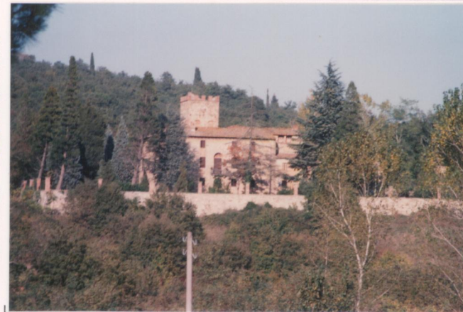
Film 600 Foto 14