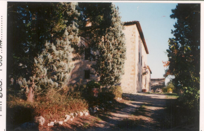
Film 600 Foto 14