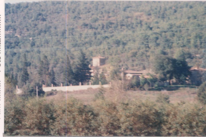
Film 600 Foto 12