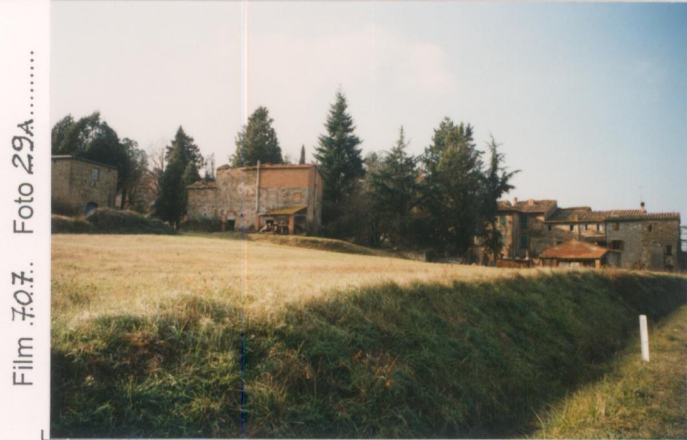
Film 407 Foto 29A.....