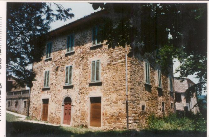
Film 439 Foto B.....