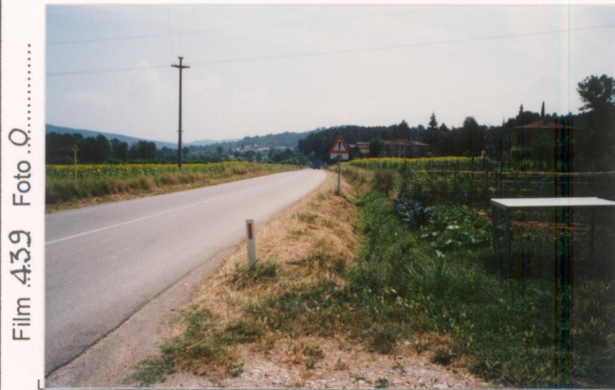
Film 439 Foto Q.....