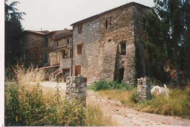
Film 439. Foto 6