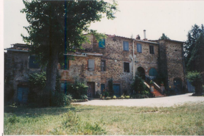
Film 439. Foto 4