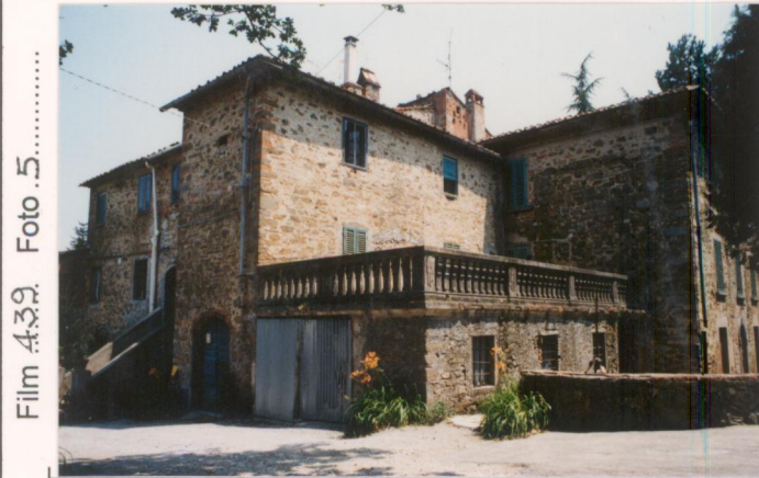
Film 439. Foto 5