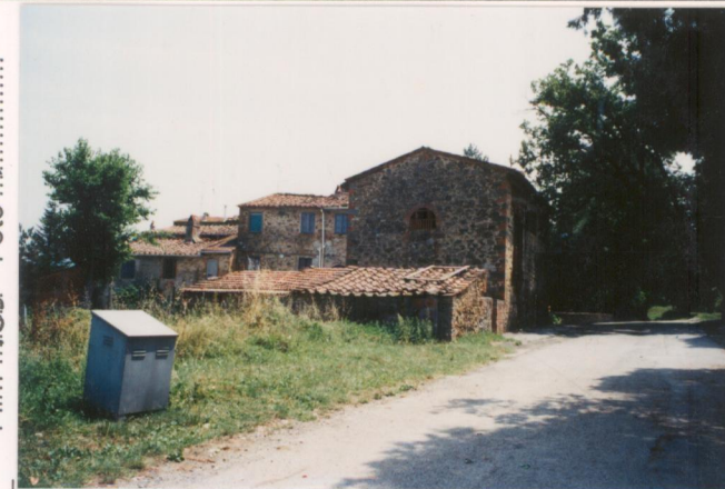
Film 439 Foto A.....