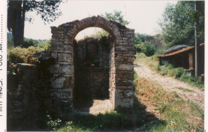
Film 439. Foto 2