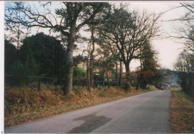
Film 707. Foto 27A