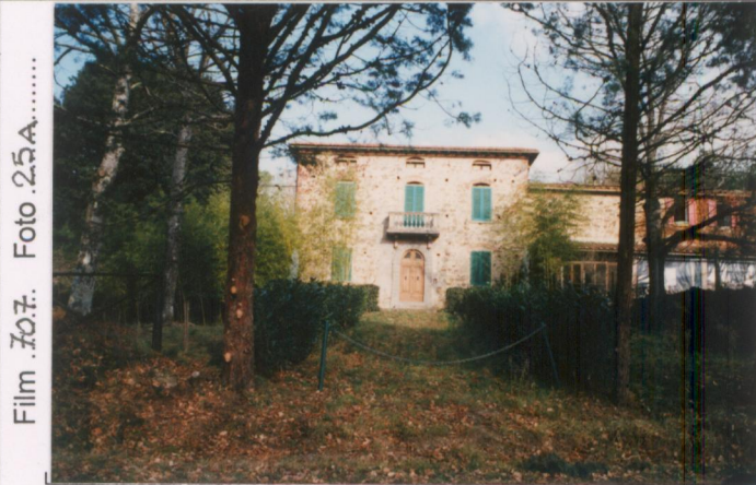
Film 707. Foto 25A