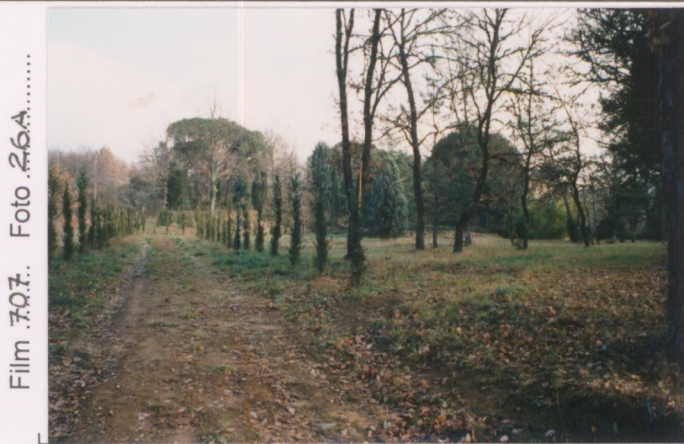
Film 707. Foto 26A