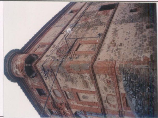
p.v. N. 4.....