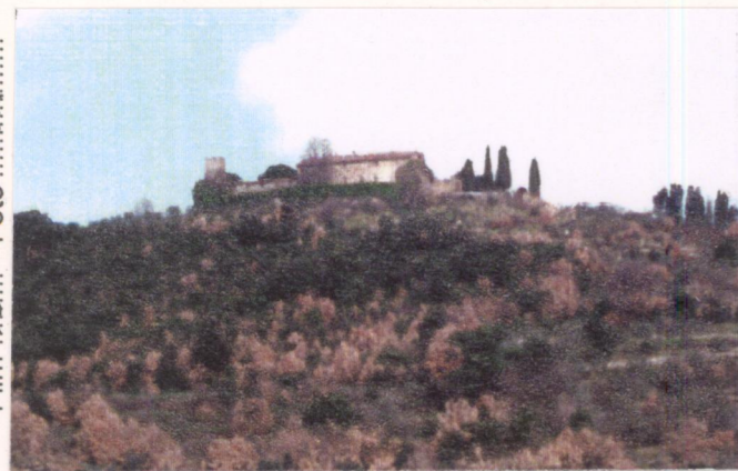
p.v. N. 1...veduta da Villa Ciudici.....