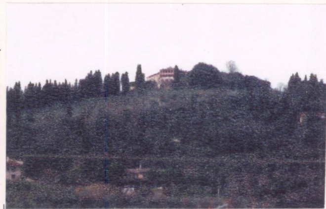
p.v. N. 2...veduta panoramica da Battifolle