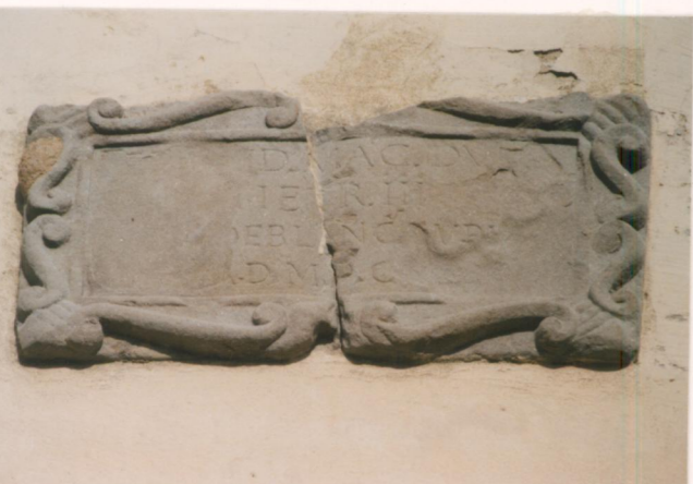
p.v. N. 16 Iscrizione sulla facciata a sud