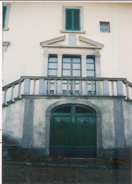
p.v. N. 5