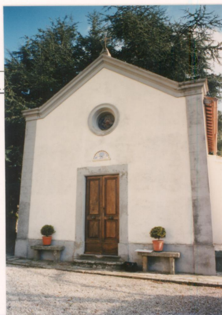
p.v. N. ....