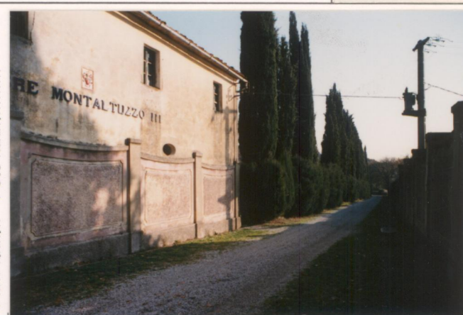
p.v. N. 8 Viale e colonica di Pod. Montaltuzzo III