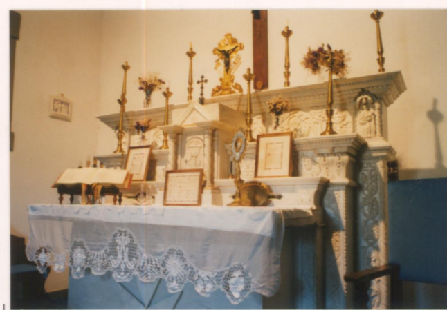
p.v. N. 13 Altare attribuito al Sansovino