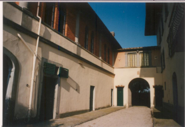
p.v. N. 6 Edifici annessi e ex-loggiato (ovest)