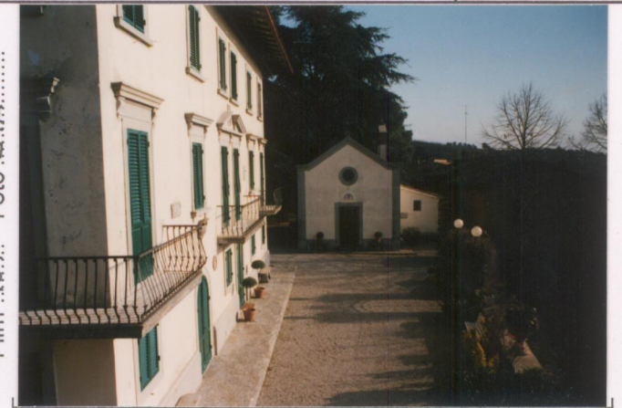
p.v. N. 4...Facciata sud e Cappella.....