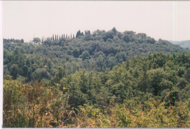
p.v. N. 1...Veduta dalla provinciale - nord.....