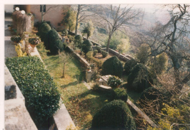
p.v. N. 11 Idem, visto dalla loggia