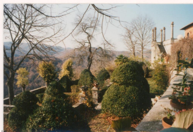
p.v. N. 10 Giardino formale a sud