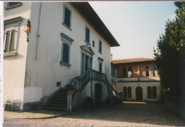
p.v. N. 3...Facciata nord.....