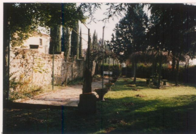
p.v. N. 9 Il giardino a fianco del viale di accesso