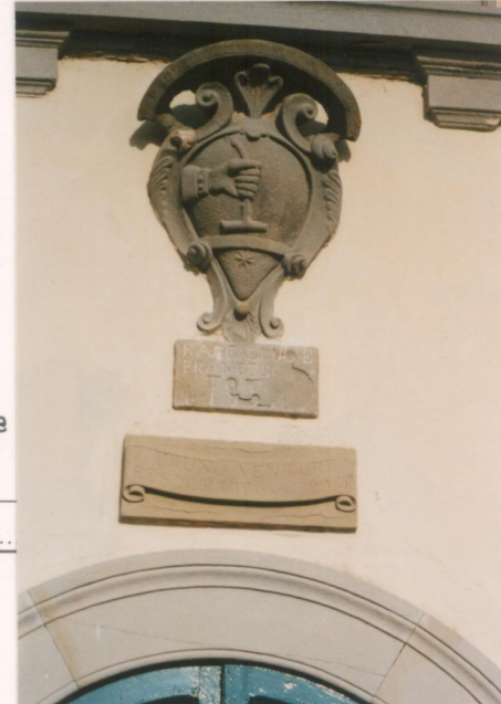
p.v. N. 15

Stemma e iscrizione sulla facciata a sud