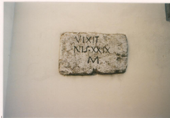
p.v. N. 14 Iscrizione sul lato destro della chiesa