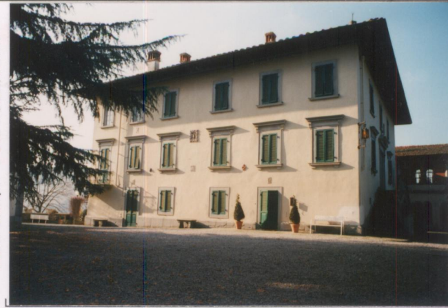
p.v. N. 2...Facciata est.....