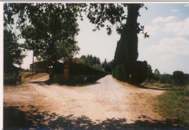
p.v. N. 7 Viale di accesso alla villa