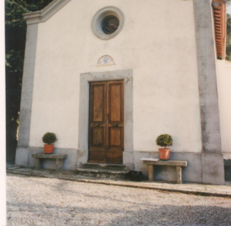
p.v. N. 12 Cappella